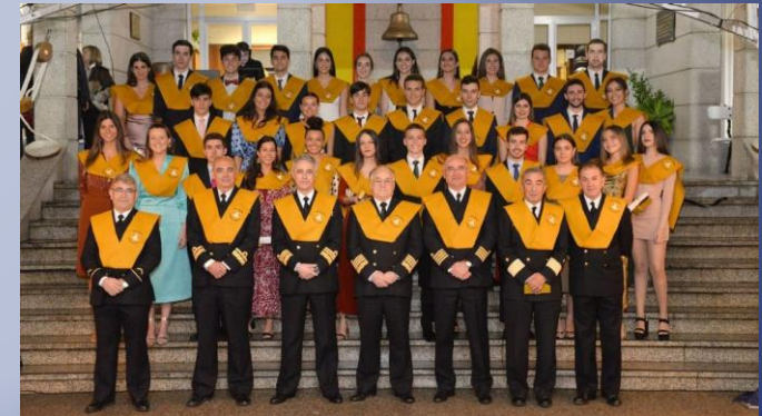
ACTOS ACADÉMICOS (Entrega Becas 2019)