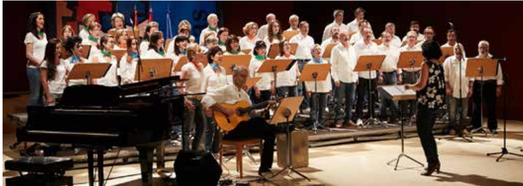
Dirigido por Kanke García Serrano, es el coro de referencia de la ciudad de Las Rozas de Madrid.

A lo largo de sus treinta y seis años de historia ha actuado en ciudades como París, Londres, Lisboa, Roma, Cuzco, Andorra, y en un buen conjunto de las principales capitales de España, además de –por supuesto- en su ciudad de origen, Las Rozas de Madrid, en cuyo Auditorio Joaquín Rodrigo actúa regularmente durante el año en todo tipo de conciertos y festivales especiales en el marco de su colaboración con la Concejalía de Cultura para organizar y dirigir actividades encaminadas a la divulgación de la música en general y del canto coral en particular.