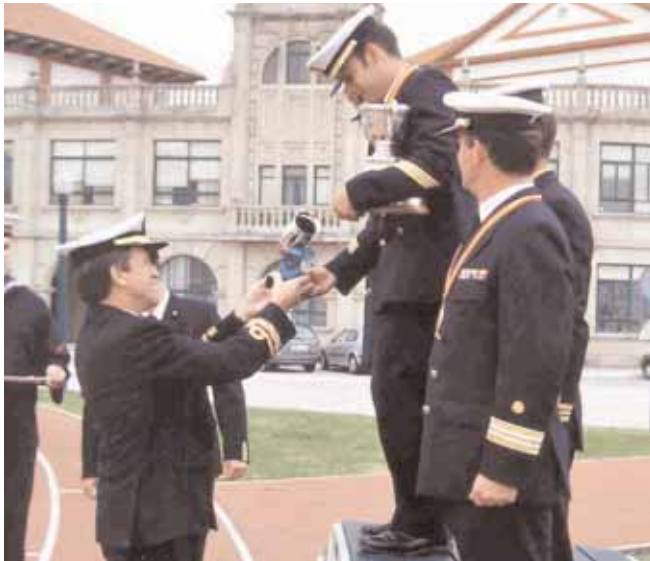
Podium XL Campeonato de Vela de la Armada.

El Campeonato de Vela de la Armada contó con participantes de 14 dotaciones, representativas de las Comisiones Navales de Regatas de Cartagena, San Fernando, Rota, Jurisdicción Central y Escuela Naval Militar. El ganador fue el que formó el equipo de la Armada en el Campeonato Nacional Militar.