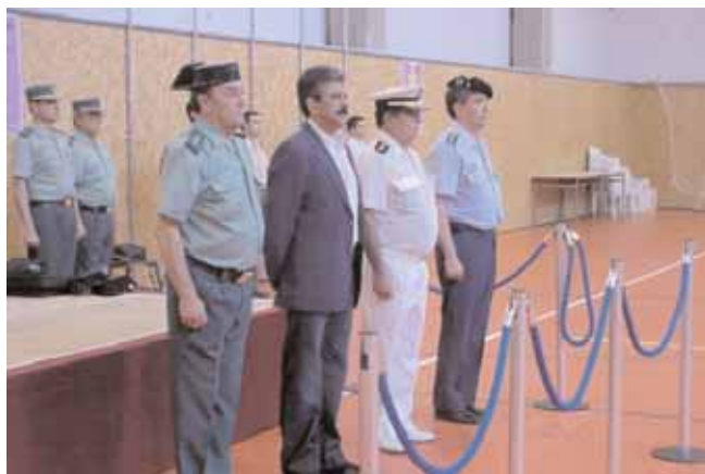
El alcalde de Ponte Genil presidió el acto de inauguración del campeonato

La Ceremonia de Clausura fue presidida por el general de brigada, Vicepresidente de la Junta Central de Educación Física y Deportes de la Guardia Civil.