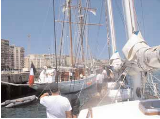
Llegada a Santander

ascenso a cabo primero y cabo profesional de las especialidades de Maniobra y Navegación (MNM), Administración (ADM) y Hostelería y Alimentación (HAM). Para llevar a cabo este adiestramiento, las