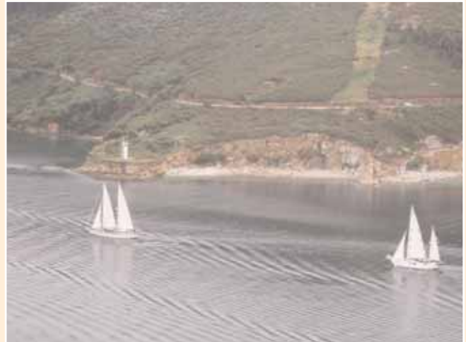
Regreso a Ferrol

Se realizó un relevo de los alumnos en el puerto de Santander. De este modo fue posible que 40 alumnos pudiesen realizar el crucero repartidos en dos turnos.