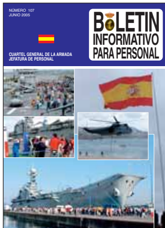
PORTADA: Escuela Naval Militar Escuela de Suboficiales ESENGRA/ESCAÑO (Vigo)