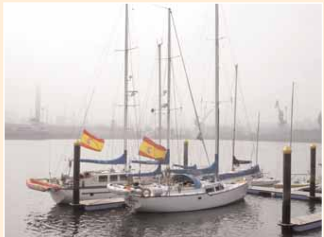
Atracados en Avilés

En anteriores cruceros se han visitado diversos puertos tanto españoles como extranjeros. Conviene destacar también la participación de las unidades del núcleo de goletas en algunas etapas de la «Cutty Sark» en el año 2002.