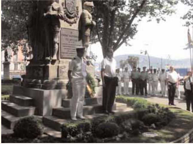
Homenaje a Pedro Menéndez

A continuación se presenta el calendario del recientemente finalizado crucero diseñado para este año: