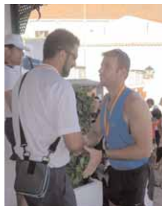
Cabo 1.º Cabello