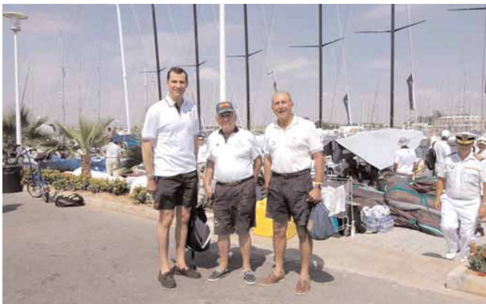
SAR el Príncipe de Asturias con el almirante Sánchez-Barcáiztegui y el CA. Rodríguez Toubes