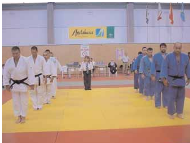
Competición por equipos