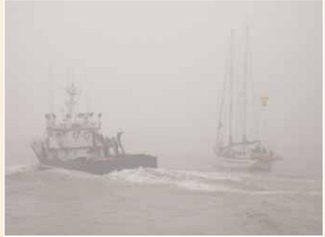
Entrando en Avilés

tienen su culminación en el crucero de instrucción, en el que los alumnos tienen la oportunidad de poner en práctica los conocimientos adquiridos durante el curso.