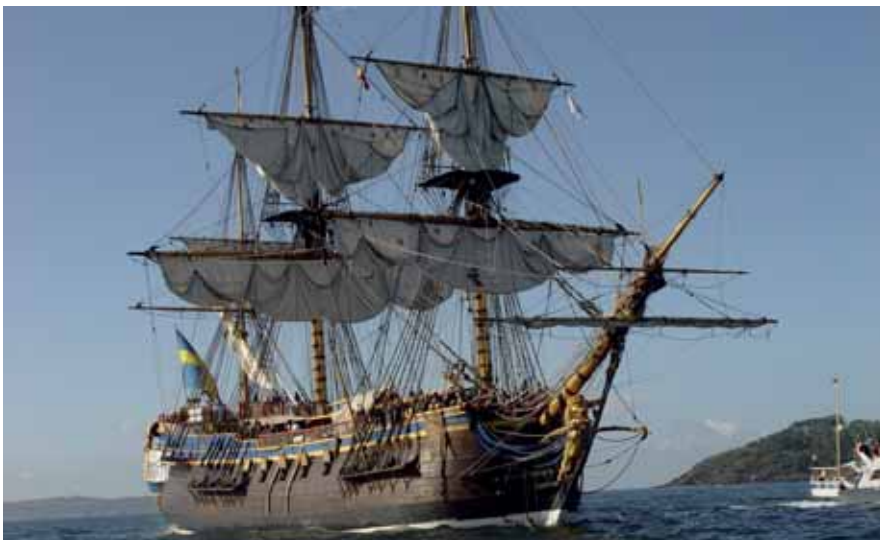
El buque escuela de la Marina sueca Göteborg

«Bueno, digamos que me limito a disfrutar con verlos pasar. La Armada no puede llegar a esta altura y a estos