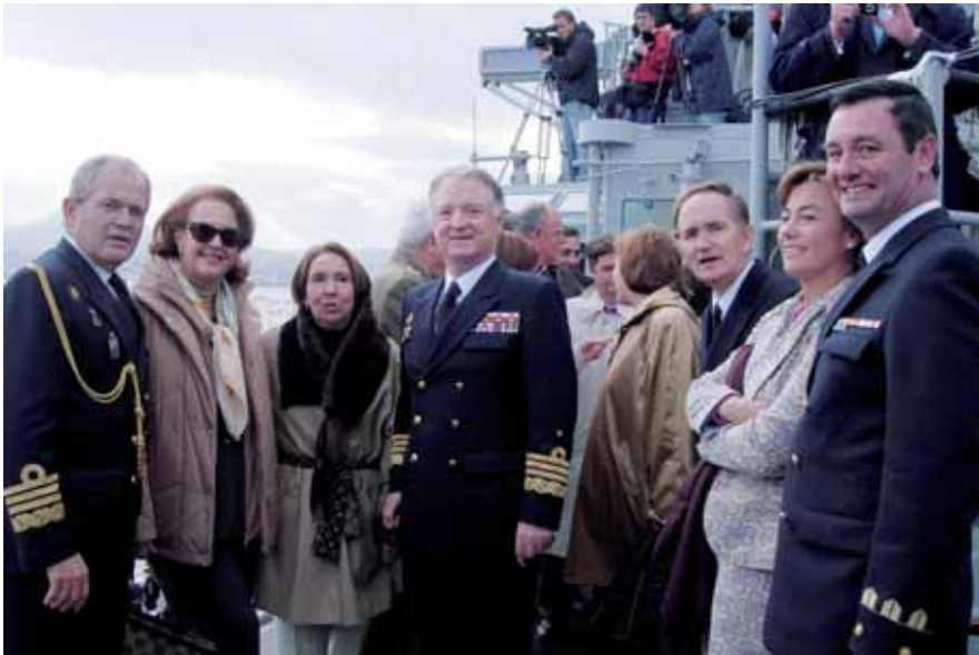
El AJEMA y otras autoridades a bordo del PA en la salida de la Volvo Ocean Race

niveles de inversión económica. Estos son profesionales que se dedican todo el año a ello y la gente de la Armada no puede compaginar este entrenamiento cuando está embarcada o debe compaginarlo con sus ocupaciones y responsabilidades. La Armada compite en regatas lo más dignamente que puede, y no está nada mal considerada.