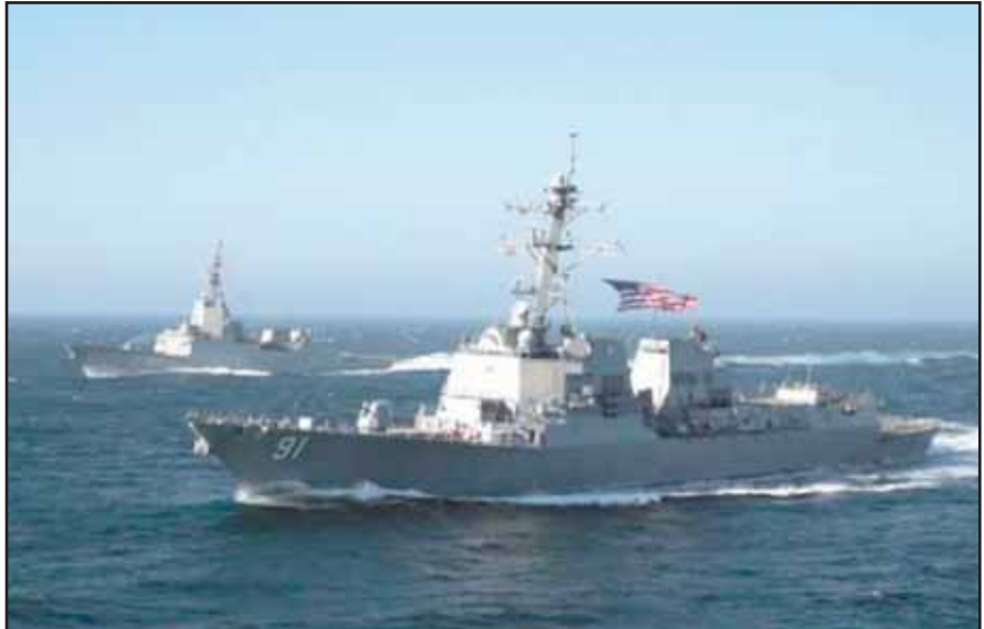
F-102 Almirante Juan de Borbón navegando con el destructor norteamericano USS Pinckney.

Según la nota remitida por la Oficina de Relaciones Públicas de la Armada, La Almirante Juan de Borbón arribó a Ferrol —de donde partió el pasado 14 de julio— el día 14 de octubre, con lo que completó un periplo de tres meses fuera de su base.