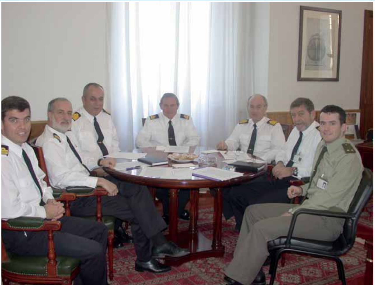
El Almirante Subdirector de Reclutamiento e Integración, en reunión diaria de trabajo.