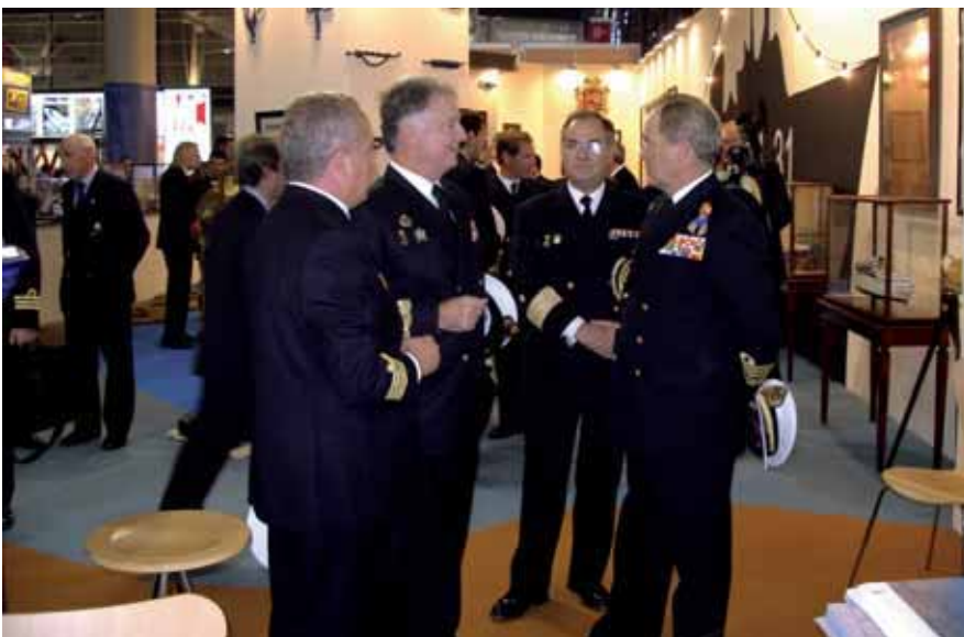
Visita al Salón Náutico del almirante jefe del Estado Mayor de la Armada, Sebastián Zaragoza Soto, acompañado del almirante González-Aller Suevos, jefe del Cuarto Militar de la Casa de S.M. el Rey, junto a dos oficiales de la Armada.

La exposición estuvo planteada como un recorrido en el tiempo a través de facsímiles, portulanos, instrumentos de ayuda a la navegación de los siglos XIX y XX y colecciones de cartas náuticas de los fondos del archivo histórico del Instituto. En ella se ofrecía con especial detalle la transformación de la costa catalana durante las últimas décadas, así como los procesos técnicos empleados en la elaboración del material cartográfico.