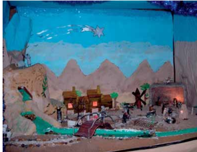
1.º Premio: Jefatura de Mantenimiento