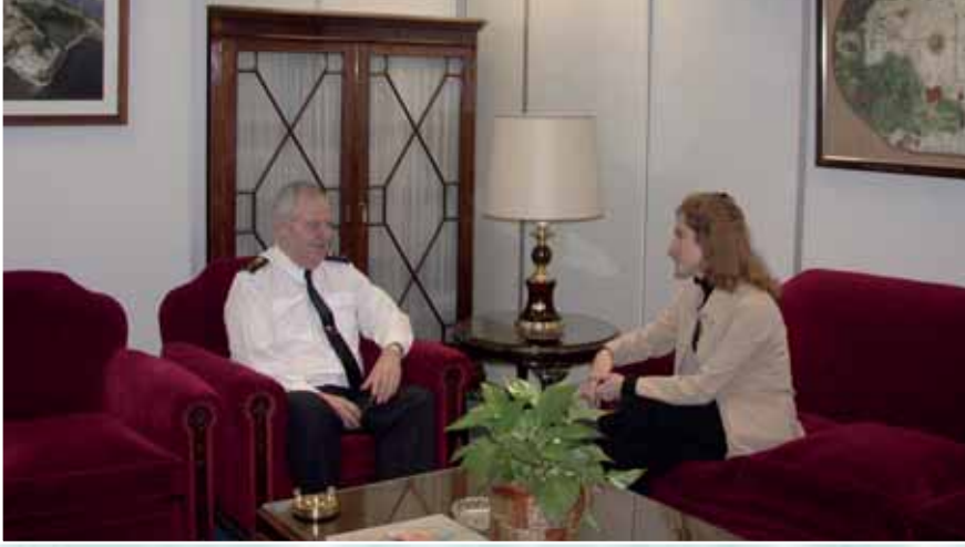
El general Hernández Moreno en un momento de la entrevista