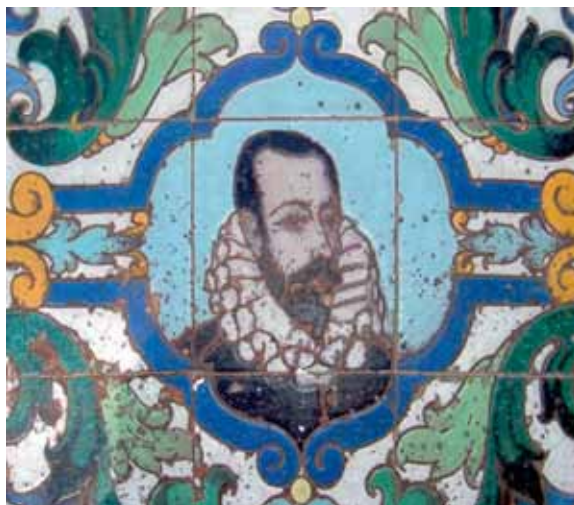
Miguel de Cervantes Saavedra

I NFANTE de marina, prisionero, mutilado de guerra, espía, aventurero y viajero. Incansable son algunas de las múltiples y variadas facetas que formaron parte de la vida militar de Miguel de Cervantes Saavedra durante su servicio en la Armada.