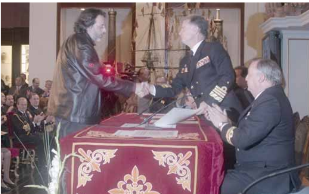
Antes de proceder a la entrega de premios, el almirante jefe del Estado Mayor de la Armada dirigió unas palabras de bienvenida a los allí

presentes y de agradecimiento a las autoridades que presidieron la ceremonia, expresando su felicitación a los galardonados: