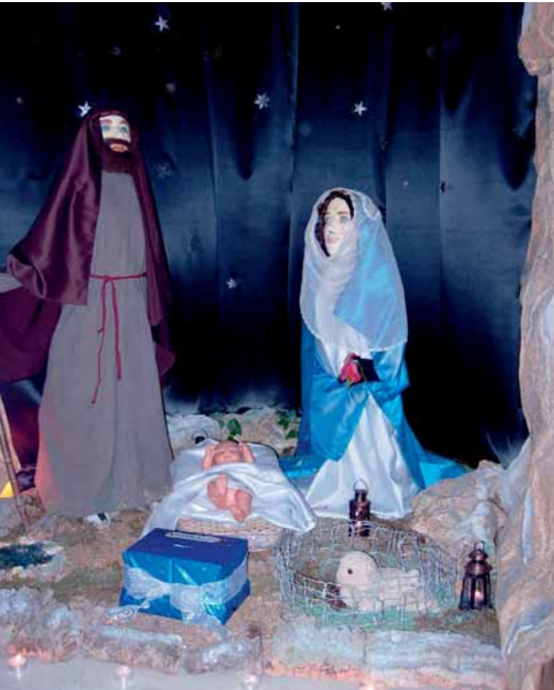
Arriba y derecha 2.º Premio compartido: CIS y MON