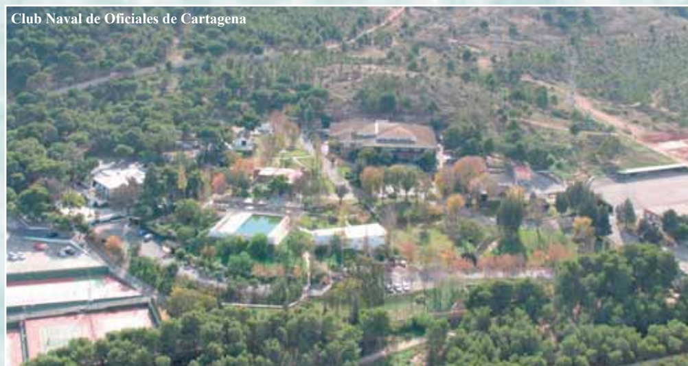
Club Naval de Oficiales de Cartagena

Además, está en estudio la creación de una Representación en el puerto de Sóller (Mallorca), con carácter interno, dada la excelente acogida que ha tenido la reciente creación de la Residencia de Acción Social de Descanso «Costa Brava», tanto a nivel nacional como internacional; así como a la existencia de doce viviendas en el