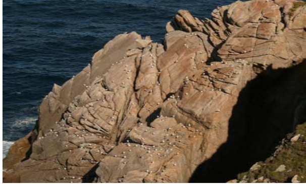
Segundo premio de Fotografía 2009 "Reunión en la Mar" Autora: Catalina Bouzas Dopazo.