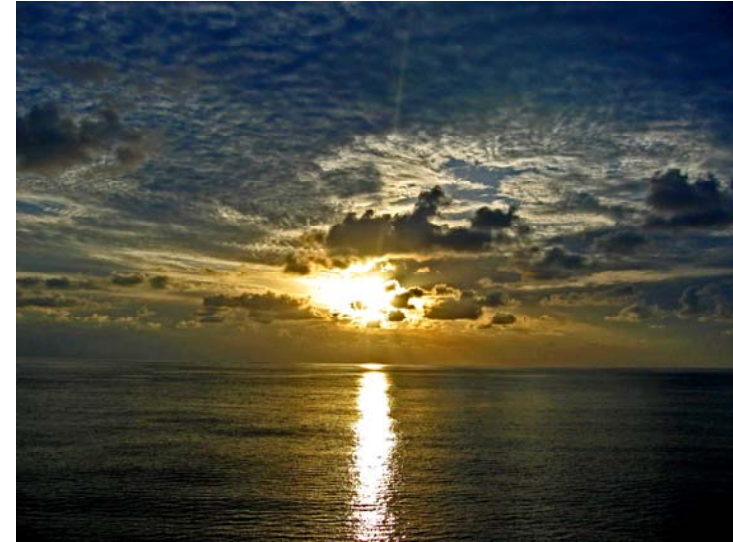
Primer premio del Concurso de Fotografía de 2009 "Esperanza"

TEMPORADA DE PRIMAVERA marzo abril mayo 2010