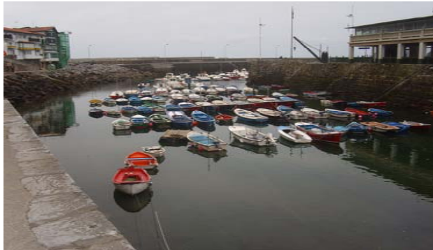
Tercer premio de Fotografía 2009 "Pueblo pesquero del Cantábrico" Autora: M a Carmen Romero Rodríguez

IV CONCURSO DE FOTOGRAFÍA "CLUB NAVAL DE OFICIALES"