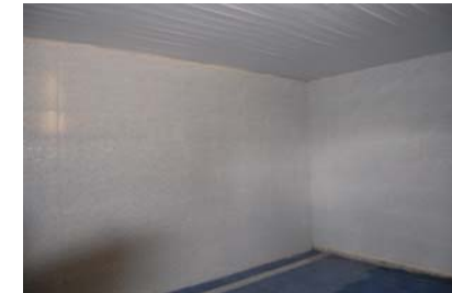
Pintado interior del polideportivo