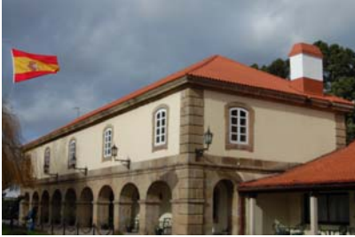
Tejado Edificio ELCANO