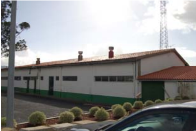
Tejado Edificio Colón