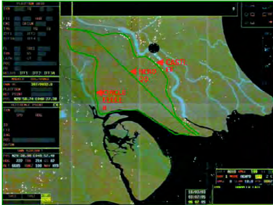
Las carreteras Castle , Hero y Circle . Obsérvense los puntos blancos en la carretera Castle , que representan vehículos. Imagen obtenida de la consola del ASaC Searchwater.

estaban siempre bajo el paraguas de los radares SPY de los destructores y cruceros americanos.