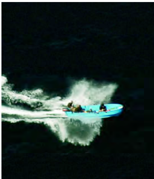
Este skiff con piratas a bordo fue localizado acercándose al mercante Sea Princess II ; en ese momento ya había sido secuestrado y no se pudo hacer nada por él.

Después de efectuar dos pasadas sobre los piratas, éstos se dan a la fuga. La presencia del P-3 ha sido lo suficientemente disuasoria. Respiramos aliviados al comprobar que no ha sido necesario ir «más allá».