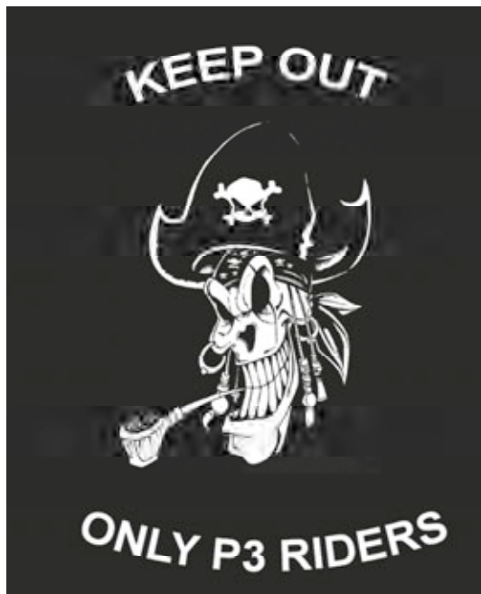
Imagen que preside el debriefing después de cada misión del P-3.

Creo que la presión en cabina subió en varias pulgadas por la cantidad de maldiciones que se escuchaban dentro del avión cuando sobrevolábamos el mercante secuestrado.