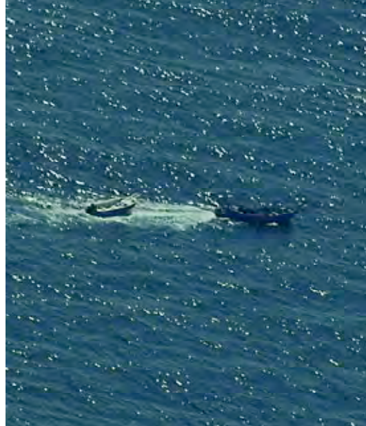
Skiff que participó en el ataque al Kriti Episkopi . Obsérvese la escala de abordaje que lleva en el bote remolcado. En ese momento se retiran, después de haberse abortado el ataque.

El teniente Rando, navegante del P-3, «plotea» la posición del mercante en la carta y comprobamos que éste se encuentra a 170 millas de nosotros.