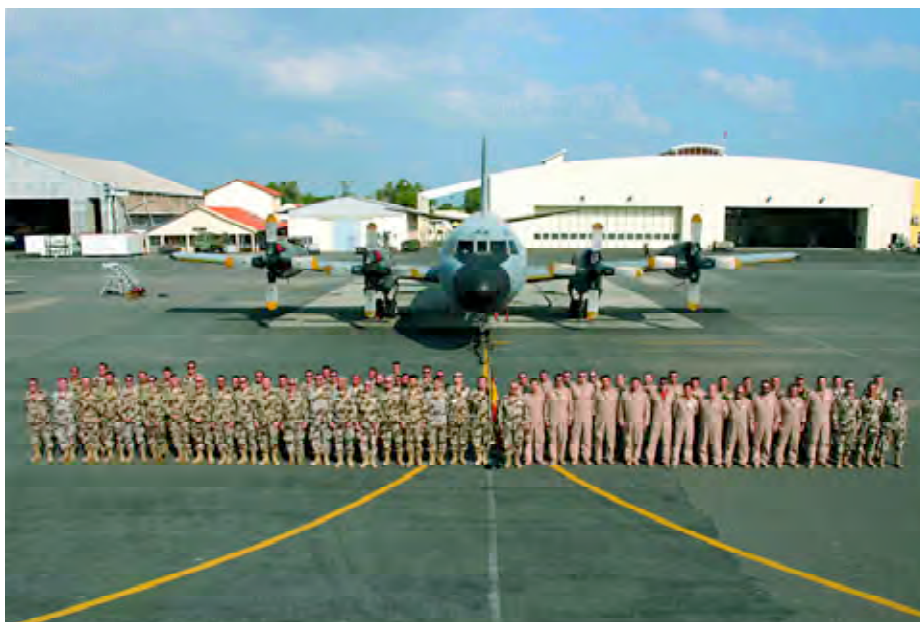
Primer Relevo de Mando del Destacamento ORIÓN en Djibouti. En segundo plano el Spanish Maritime Patrol Aircraft , que empieza a ser muy popular entre el tráfico mercante de la zona y seguro que también entre la piratería.

Localizamos a los skiffs presentes en la zona y un DHOW en las inmediaciones, comprobándose que se trata del grupo que fue investigado al comenzar la patrulla y que con toda probabilidad es el que cometió el primer ataque de