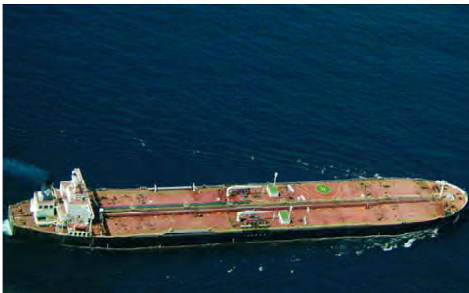
Petrolero griego Kriti Episkopi navegando libremente por el golfo de Adén, después de haber sido abortado su secuestro por el P-3 español.

Ayer volamos en una misión de apoyo directo a una fragata francesa que permanecía en el golfo de Adén, proporcionando seguridad al tráfico mercan-