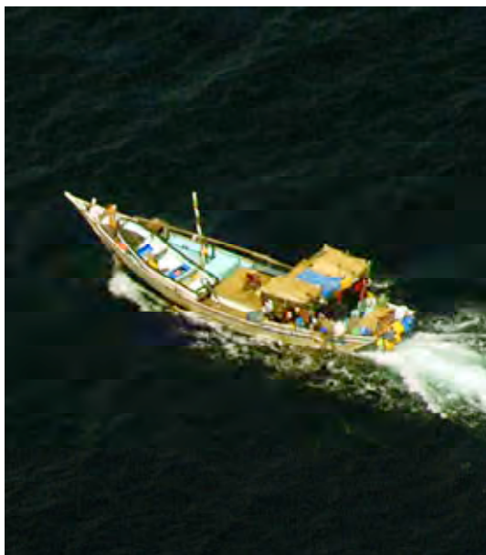
Este DHOW fue localizado en las proximidades del ataque al Kriti Episkopi , navegando con rumbo paralelo al de los skiffs . Se sospecha que puede servir como buque de apoyo a la piratería.

Se recibe una segunda comunicación del mercante en la que se aprecia gran preocupación por el rápido acercamiento de los skiffs , que ya se encuentran a dos millas.