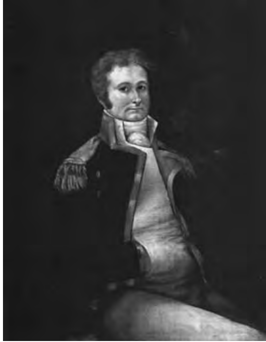
Teniente de navío. Principios siglo XIX.

Al implantarse La Gloriosa en 1868 (8), el empleo de teniente de navío siguió unas vicisitudes similares a las de capitán de navío, al dividirse la escala en dos clases: de primera y segunda. Formaron la de primera los ochenta tenientes de navío más antiguos, disfrutando del sueldo asignado a la clase de comandante de Infantería del Ejército. En 1873 se dispuso que éstos tuvieran, dentro del Cuerpo, el carácter de jefes. El resto de los tenientes de navío continuaría con la misma asimilación —capitán del Ejército— y con el mismo sueldo. Tres años más tarde (9) se dispuso que el teniente de navío de primera clase fuese el