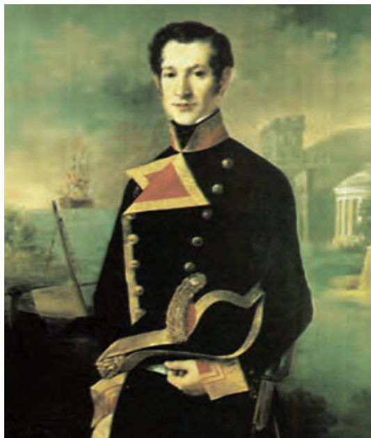
Capitán de fragata. Medios del siglo XIX.

que servían, de forma similar al Ejército, donde existían (y existen) armas de Infantería, de Caballería, de Artillería o de Ingenieros. En cada cuerpo había tres empleos de oficiales particulares, que eran estancos y no comparables en cuanto a antigüedad se refiere.