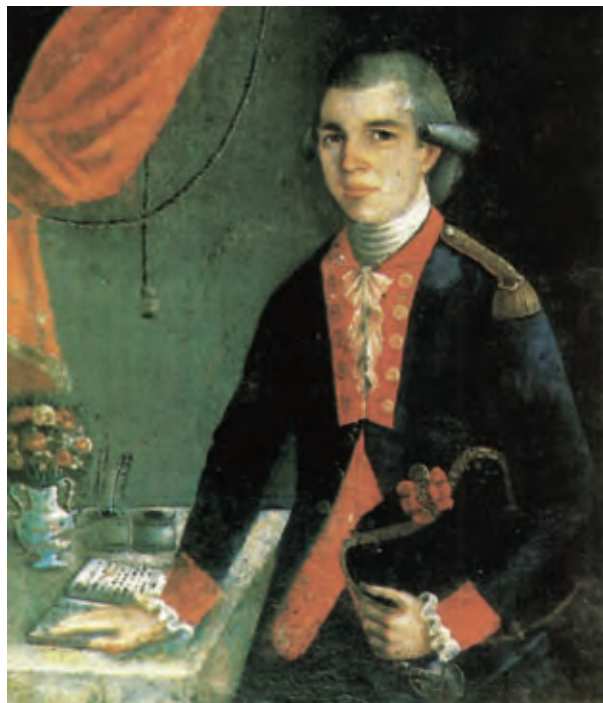
Teniente de fragata. Finales del siglo XVIII.