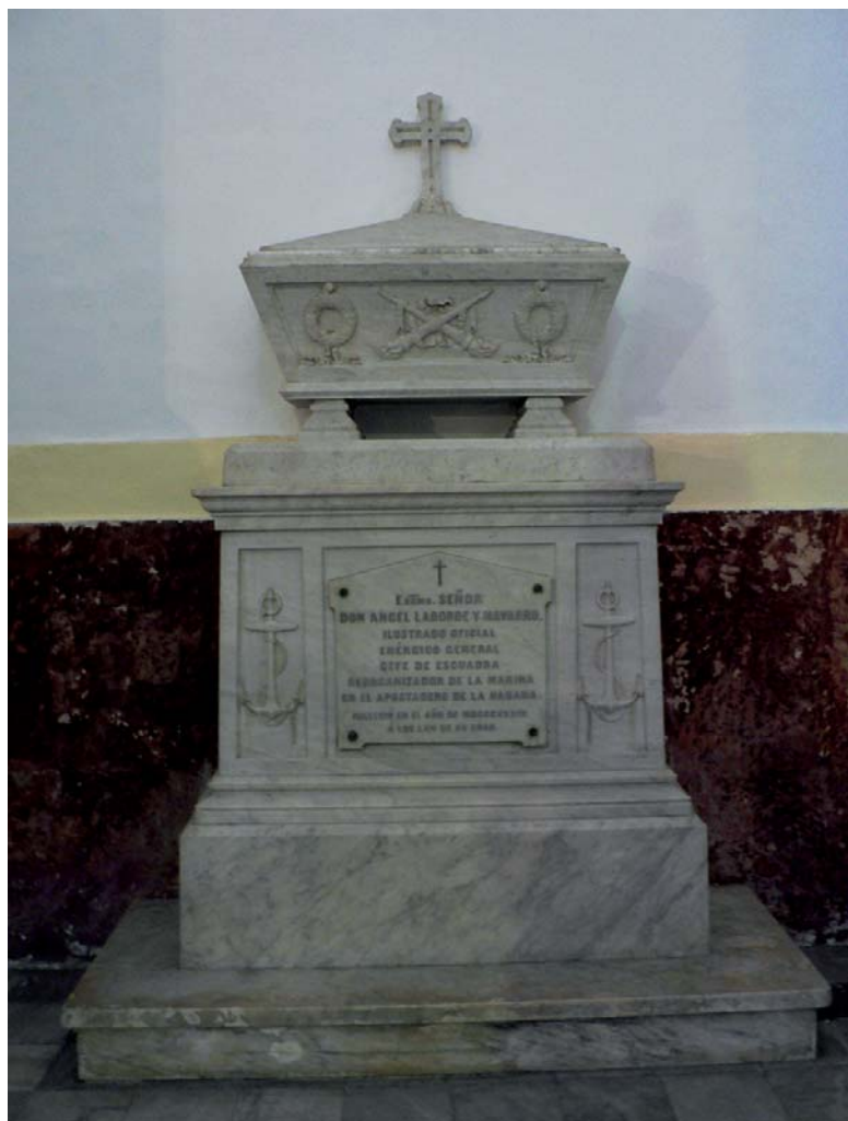
Monumento fúnebre de Ángel Laborde (Cádiz, 1772-La Habana, 1834) en el Panteón de Marinos Ilustres, en el que se hallan depositados sus restos mortales.

— La incapacidad de los rebeldes había sido suplida por los extranjeros, quienes se habían entrometido en las disensiones políticas ajenas con una audacia que el autor calificaba de «inmoral», cubierta con banderas y patentes de insurgentes, para realizar actividades corsarias contra los españoles.