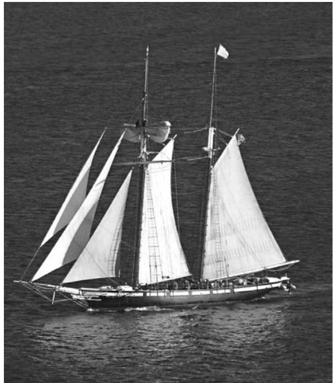
Réplica de clíper de Baltimore .

Al capitán del buque armado en corso le eran entregadas tres patentes: la «patente de navegación», acreditativa de la nacionalidad, que permitía navegar bajo la enseña tricolor; la «patente de corso», que le autorizaba a actuar como tal, según lo estipulado, y la «patente de presa», que portaría la embarcación apresada hasta llegar a su puerto de destino, donde sería declarada la captura como buena o mala presa. Precisamente, en la única carta conocida de