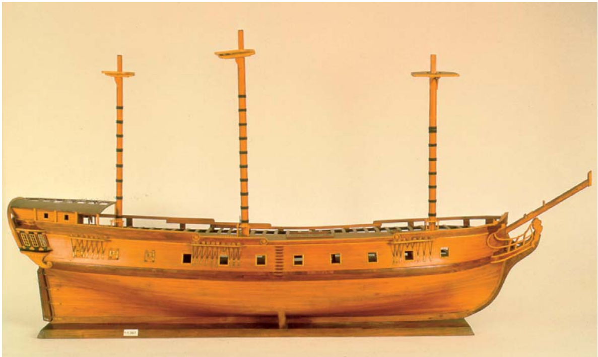
Maqueta de la corbeta Descubierta . (Museo Naval. Madrid).