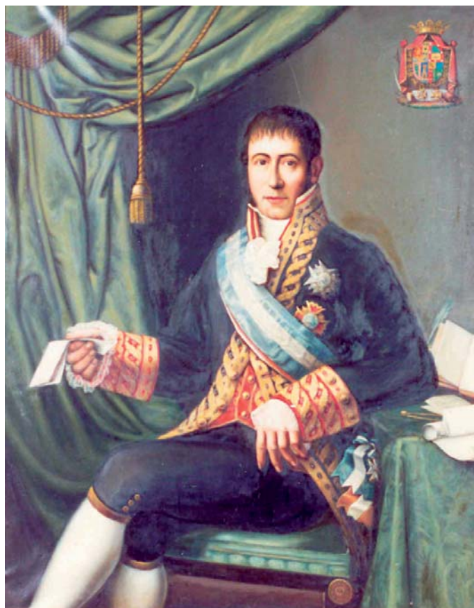
José Vázquez de Figueroa. (Museo Naval. Madrid).

abandono. Entre otros factores que provocaron su ruina me permito destacar el hecho de que a partir de 1817 (9), con objeto de aprovechar los medios y el personal de arsenales y astilleros dependientes de la Secretaría de Marina, se dispuso que los buques de categoría a inferior al porte de corbeta fueran construidos y mantenidos por contratas con particulares. Las ventajas de este sistema eran el ahorro en costes que se conseguía al erario público, y que la maestranza, despedida por falta de pagas, podría con esta medida encontrar trabajo gracias a la iniciativa de construcción privada, asegurándose además el sueldo con ello. Como alternativa era buena, aunque ajena a la realidad de un país carente de recursos y subdesarrollado,