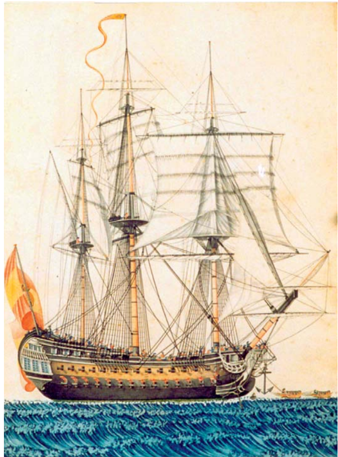
Navío San Telmo . (Museo Naval. Madrid).

1824.—El 26 de mayo, el bergantín-goleta Mágica naufragó en cayo Confites (canal viejo de Bahamas).