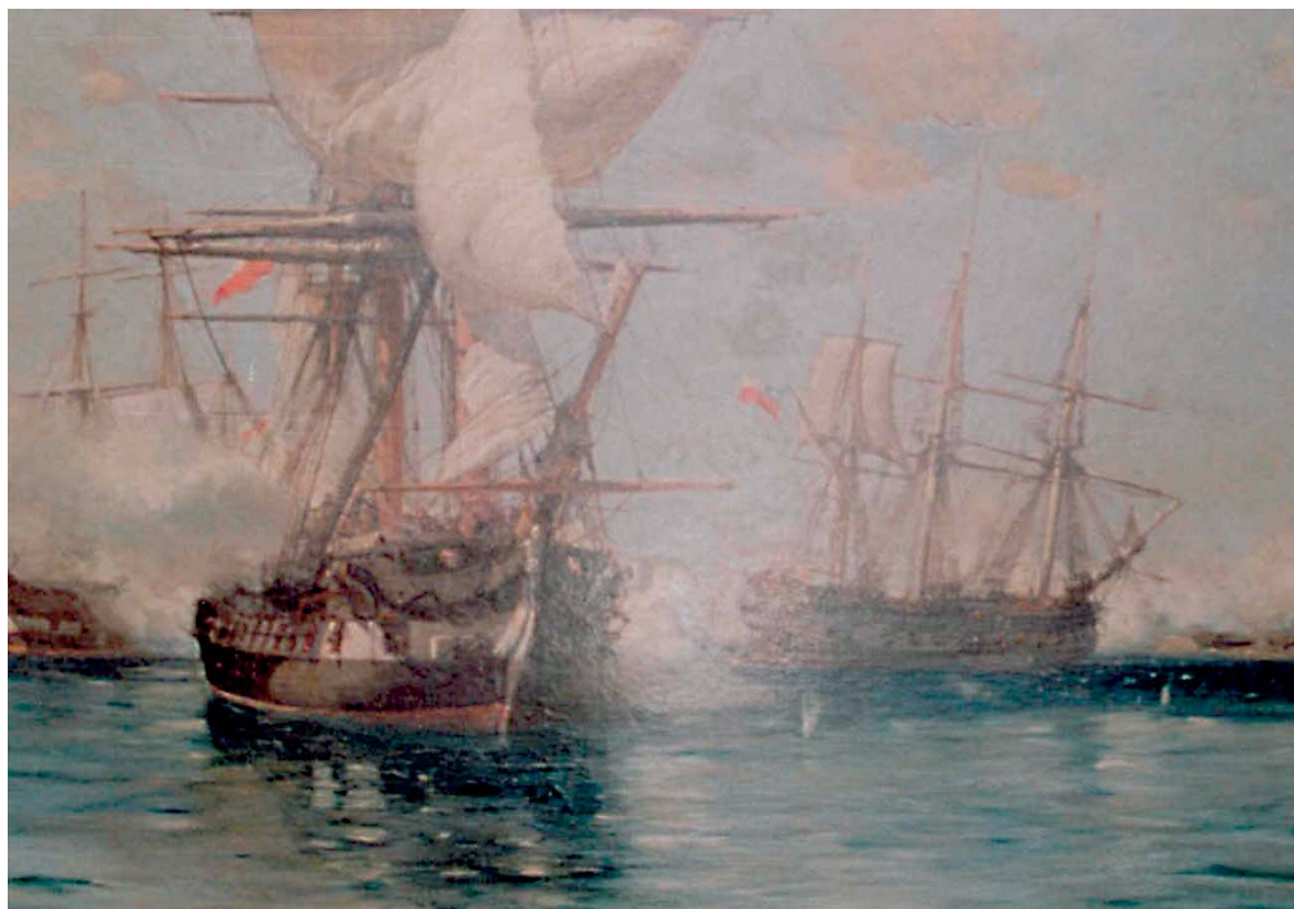
Captura de la fragata Reina María Isabel . (Óleo de Somersal).

1818.—El 17 de mayo es apresada la goleta-correo Ramona en el tránsito de Puerto Rico a Costa Firme.