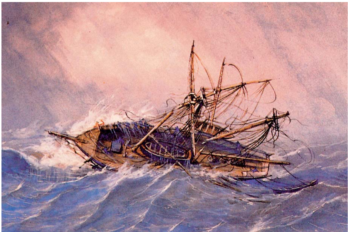
Nafragio de una goleta. (Museo Naval. Madrid).

1813.—Exclusión en La Habana del bergantín Regencia y la fragata Cornelia .