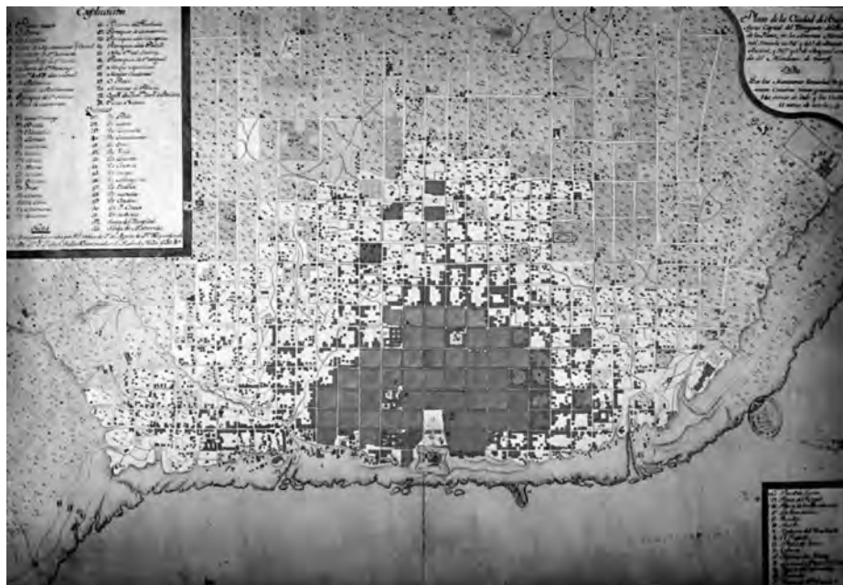
Buenos Aires, 1776.