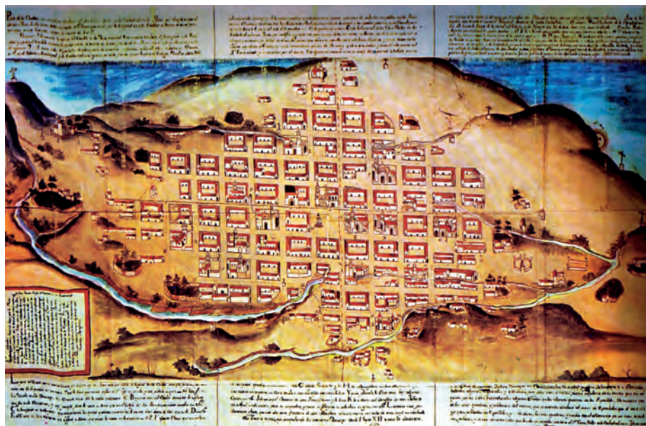
Plano de la ciudad de La Plata, Charcas o Chuquisaca, año 1779.

Todo se interrumpe, los acontecimientos se precipitan, los pueblos se sublevan, las lealtades defecionan, la impiedad se generaliza y los hombres,