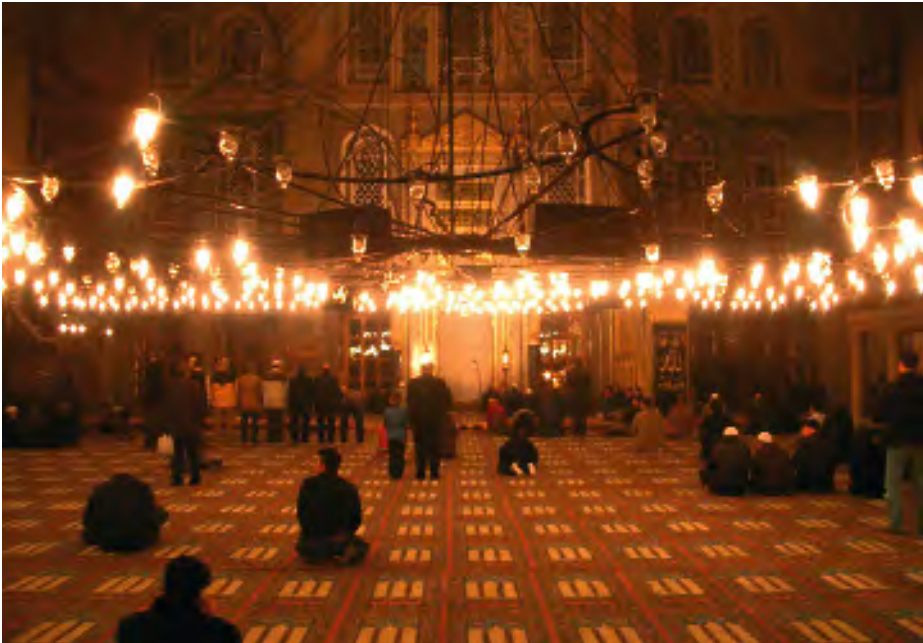
Interior de la Mezquita Azul de Estambul.

Para los musulmanes, Mahoma fue el último de los profetas enviados por Alá, con la misión de recordar y completar los mensajes de sus predecesores, entre los que incluyen a Jesús.