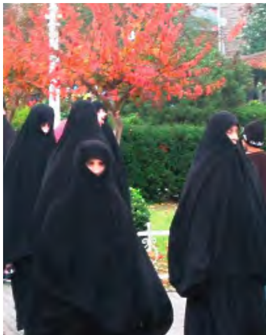
Grupo de mujeres paseando por Estambul.

dos indistintamente en los medios de comunicación, cuando en realidad tienen significados distintos.