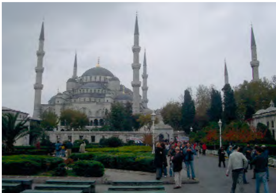
La Mezquita Azul o del sultán Ahmed de Estambul.

Si somos de los que pensamos en el primer grupo de palabras, podremos decir que tenemos cierta idea sobre el tema del artículo. Podemos creer que el islam sólo es una de las tres religiones monoteístas, junto con el cristianismo y el judaísmo. El término islam proviene del árabe al-islām , que significa paz y sumisión a Dios (Alá). La persona que practica el islam se denomina musulmán, que significa sometido a Alá, y no mahometano. Mahoma fue el último de los profetas enviados por Alá y al que reveló el Corán (libro sagrado del islam).