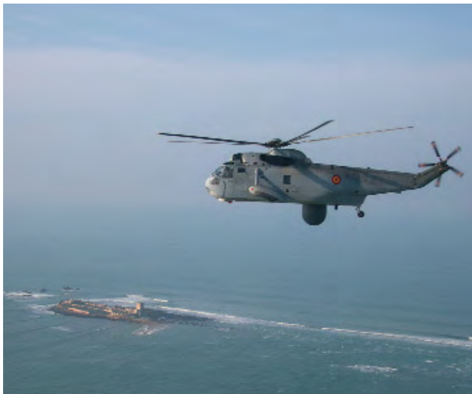
Morsa 509 sobre Sancti Petri.

medida contra las contramedidas electrónicas y los sistemas de armas antimisiles.