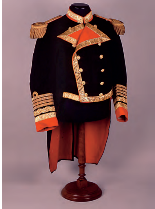
Uniforme de gala de capitán general de la Armada según el Reglamento de Divisas establecido en 1909. (Museo Naval. Madrid).

¿De dónde tomó la Armada española este peculiar emblema? Pues resulta que, aunque es cierto que en 1909 ya eran varias las marinas europeas que la