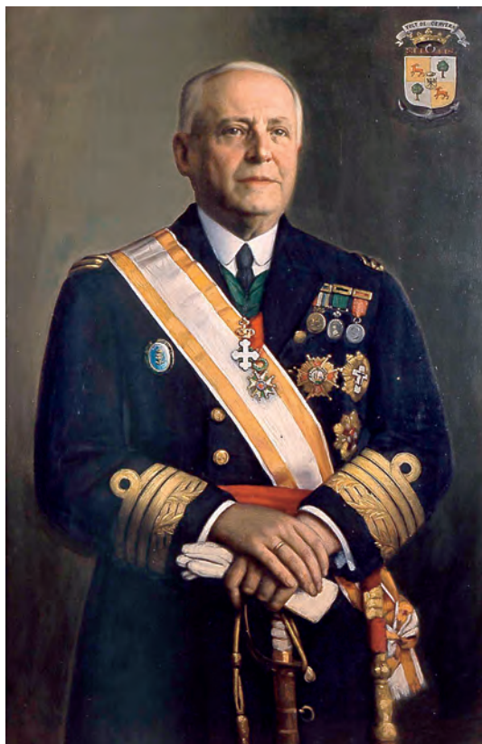
El almirante don Juan Cervera Valderrama, que siendo jefe del Estado Mayor de la Armada promovió a finales de 1936 el restablecimiento del sistema de galones con coca, suprimido en 1931. (Óleo de Julio García Condoy. Museo Naval. Madrid).

Siempre en el bando nacional, en 6 de febrero de aquel mismo año (Boletín Oficial del Estado del 6) se confirmó el uso de la coca a los antiguos jefes y oficiales de la Escala de Reserva Auxiliar del Cuerpo General de la Armada (creada en 1918 y extinguida en 1932), y también a todos los jefes y oficiales de la Reserva Naval (creada en 1915 y reorganizada en diciembre de 1936), es decir, a los capitanes y pilotos de la Marina Mercante que habían sido movilizados durante la guerra. Todo este personal, como el afecto al Cuerpo de Servicios Marítimos (creado en 1932), usaba con anterioridad —y este uso se mantuvo al menos hasta 1937— unos curiosos galones ondulados, sin coca. En todo caso, y para evitar alguna confusión que al parecer se produjo entonces, otra orden, dictada el 11 de mayo de 1937, dispuso que todos los jefes y oficiales de la Reserva Naval y los habilitados, provisionalmente y mientras duren las actuales