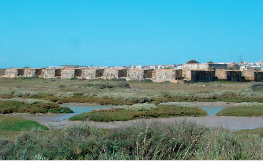
Defensas de San Fernando.

bre de ese mismo año, editado en Londres por la imprenta R. Juigné. El manifiesto se estructura en treinta y siete páginas introductorias, en las que el duque explica el conflicto con la Junta de Cádiz y sus motivos. A continuación, aporta una serie de documentos que apoyan su defensa y que justifican sus quejas ante dicha Junta.