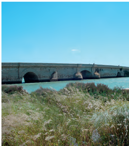
Puente Suazo (San Fernando, Cádiz).

el 18 de febrero de 1811, acompañado por el coronel Mazarredo, su protector durante su estancia en Londres. Tenía treinta y cinco años. Seis meses después de su muerte, en agosto, sus restos fueron devueltos a España y a su viuda. El 22 de agosto se celebró una misa solemne en la iglesia gaditana del Carmen, para ser posteriormente enterrado en la cripta de ese mismo templo junto al almirante Gravina. Unos años más tarde se exhumaron sus restos y se trasladaron al panteón particular de la familia en la parroquia de Omnium Sanctorum de Sevilla (17), para ser nuevamente exhumados y llevados a Cuéllar, a la Iglesia de San Francisco. Dicha ige-