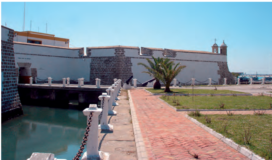
Castillo de Puntales, Cádiz.

las Cortes y que era el único que probablemente podrían reconocer las demás Provincias y América. De aquí nació el declarado desafecto que desde entonces me profesó la Junta de Cádiz.» (10).