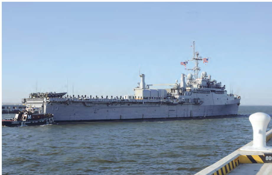
LPD Nashville .

En la recién concluida operación APS 09, llevada a cabo entre enero y junio del presente año, sólo se utilizó un buque, el LPD USS Nashville , con una dotación reforzada y un Estado Mayor Multinacional, para intentar alcanzar los objetivos iniciales mencionados. Éstos persiguen, en definitiva, un aumento de la credibilidad de los Estados Unidos en la zona y una mejora de la seguridad marítima de las costas de África occidental, todo ello con el concurso de otras agencias norteamericanas, organizaciones no gubernamentales y países aliados.