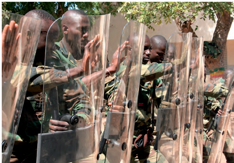
Práctica de control de masas en Senegal.