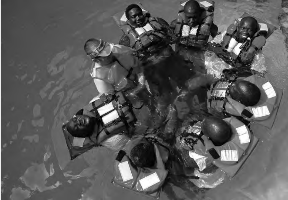
Práctica de supervivencia en la mar.