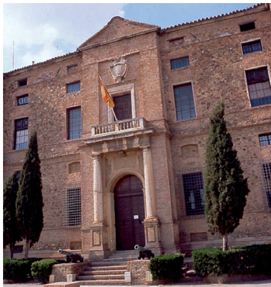
Archivo General de la Marina «Álvaro de Bazán». El Viso del Marqués (Ciudad Real). En 1948, por Decreto de 26 de noviembre, se crea el Archivo-Museo «Don Álvaro de Bazán» en el palacio de los marqueses de Santa Cruz, en El Viso del Marqués (Ciudad Real) «para constituir en él el Archivo General de la Marina».

requieren una mayor atención para orientarse en los fondos, los estudiantes (de diferentes niveles educativos: secundaria, bachillerato, universidad y enseñanza militar) para los que los servicios educativos son el procedimiento que mejores resultados da, y los ciudadanos en general, a los que se les debe facilitar el acceso a los documentos de acuerdo a la legislación vigente y suscitar su interés mediante procedimientos llamativos, como exposiciones y publicaciones, principalmente. Finalmente, no hay que olvidar la formación de los usuarios, pues aunque seamos capaces de mejorar sustancialmente el acceso a los contenidos es evidente que el usuario precisará de una cierta formación que le permita enfrentarse a los archivos con unas mínimas garantías de éxito (15).