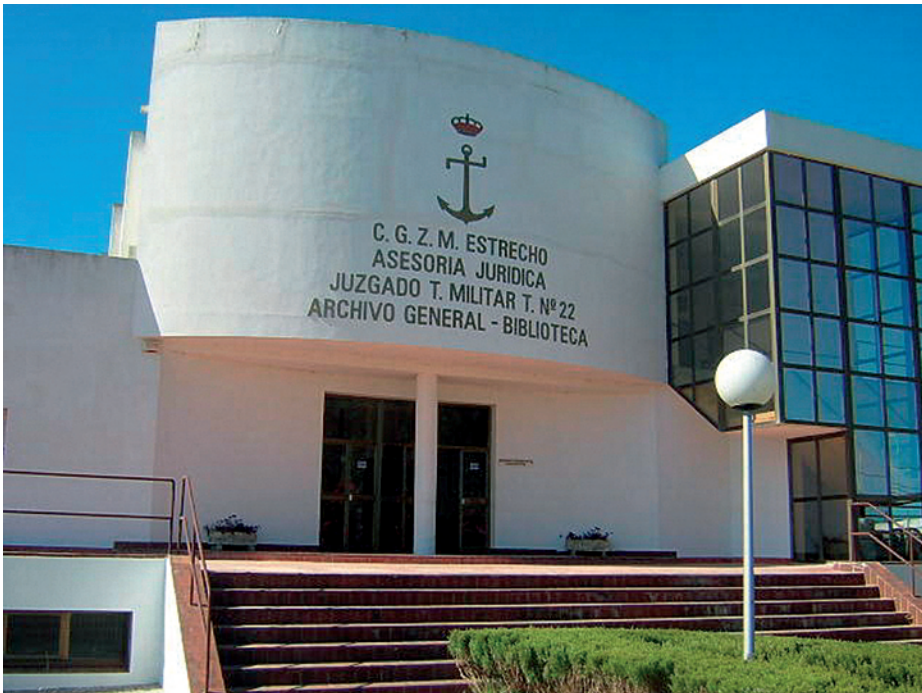
Archivo Naval de San Fernando (Cádiz). Archivo Intermedio.