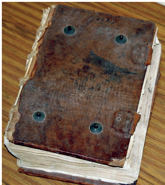
Libro de forzados. Cartagena.

divulgativas. Estas acciones, que favorecen la relación entre el mundo de la educación y el mundo de la archivística, son los prolegómenos de un futuro servicio didáctico (22). Éstos nacen, pues, con la finalidad de ofrecer a los alumnos un contacto directo con los documentos. Su implantación se ve beneficiada por la evolución de los métodos pedagógicos, que intentan potenciar la observación y la experimentación del alumno frente a la clásica enseñanza, que pretendía convertir al alumno en un mero receptor pasivo de conocimiento (23).