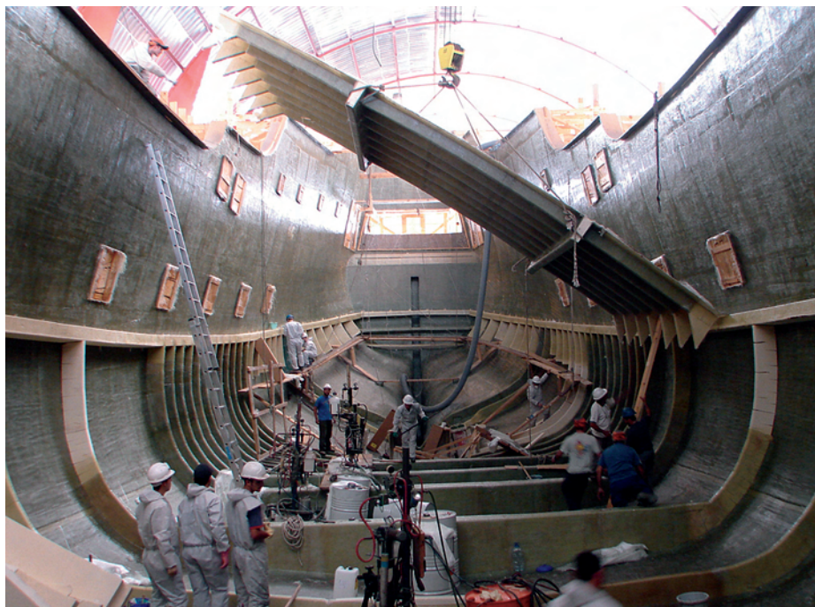
Montando una de las cubiertas. Junio 2009.

desde popa. En la línea de flotación disponían la manga máxima, que iba disminuyendo en progresión hasta la popa, con el objetivo de reducir en lo posible los pesos altos que podrían alterar la estabilidad de la nave.