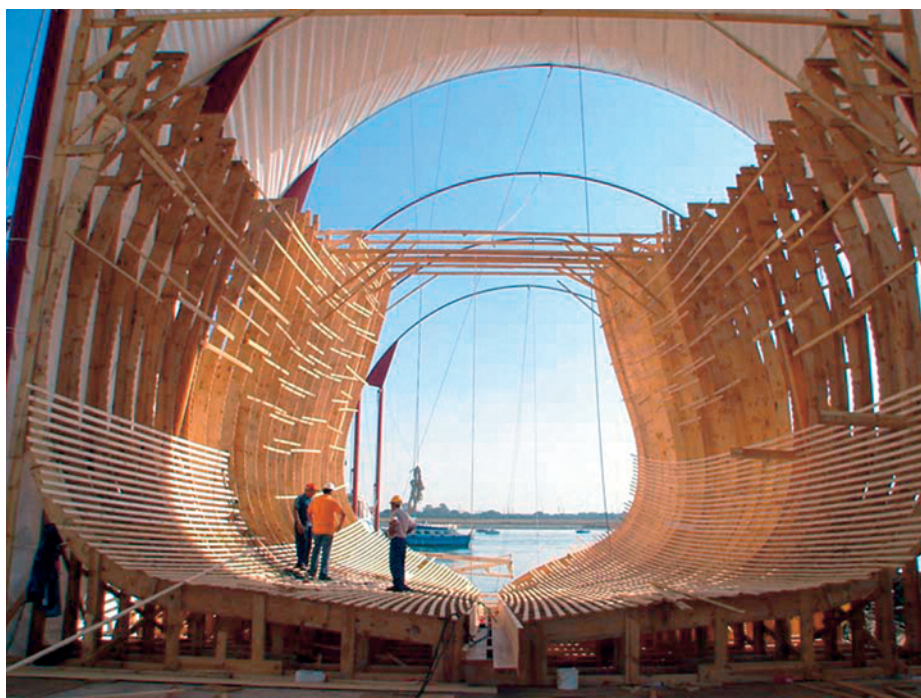
El armazón del galeón en octubre de 2008.

La flota de Tierra Firme partía de Sevilla y hacía escala en Cartagena de Indias y Nombre de Dios (Panamá), mientras que la flota de Nueva España, zarpando también desde Sevilla, ponía rumbo a Veracruz (México). Ambas flotas canalizaban gentes, ideas y mercancías procedentes de toda América, enlazando con la otra gran ruta comercial que extendía la navegación hacia el Pacífico: la del Galeón de Manila o Navío de la China (siglos XVI-XIX). Esta