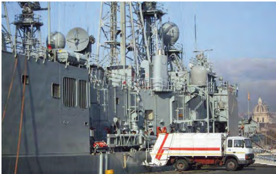
NAMSA apoya en puerto a las unidades navales a través de su Programa de Servicios Portuarios.