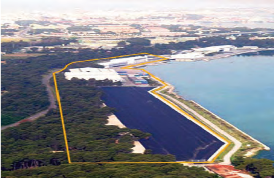
Instalaciones de almacenamiento de NAMSA en Tarento (Italia).

Servicios Logísticos, Servicios Portuarios, Transporte y Almacenamiento, e-Logística, por citar sólo algunos. Así, la mayor parte de los costes operativos comunes con cargo a ATHENA que pueda solicitar el comandante de la operación y sean aprobados por el Comité Especial cabría obtenerlos a través de la NAMSA.