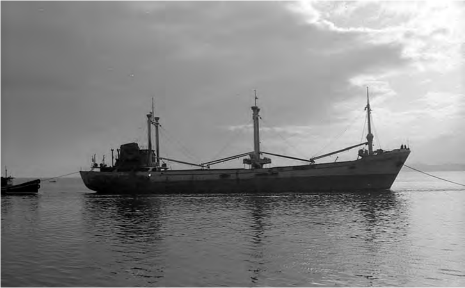
Vista de nuestro protagonista en el puerto de Santander.

radio y algunos marineros prestaron auxilio al capitán, que se encontraba tendido en el suelo. A pesar de su estado ordenó enviar un mensaje de socorro y arrancar las bombas contraincendios. El segundo oficial intentó apagar la luz del comedor cuando una ráfaga impactó en su brazo, desgarrándolo hasta dejar el hueso al descubierto. Enseguida el fuego de la chimenea alcanzó grandes proporciones, y los maquinistas, que inicialmente pensaron que podía tratarse de disparos de aviso para detener el buque, bajaron a la sala de máquinas a parar el motor principal, lo que provocó que se apagaran las luces (por la dinamo de cola). Al abandonar la sala de máquinas, el primer maquinista recibió un tiro en la pierna pero sin afectar al hueso. El telegrafista decidió regresar a la cabina de radio, en la misma cubierta del puente, para transmitir un mensaje de socorro que se lo impidió el fuego y la antena destrozada. La primera pasada completa había durado alrededor de cuatro minutos y el efecto era devastador.