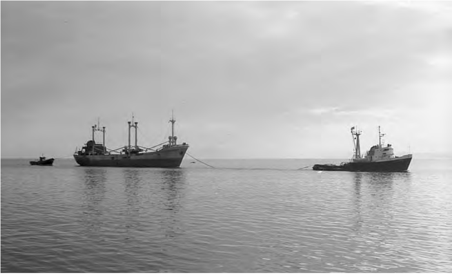
De vuelta a casa. El Sierra Aránzazu hace su entrada en Santander remolcado por el Finisterre . (Foto: T. Dietrich).

estar bajo vigilancia. Por fin, el 25 de diciembre llegaron a Las Palmas atracando de noche en el Puerto de la Luz. Tras varios días de espera se confirmó que su destino sería Santander. El 5 de enero de 1965, en pleno viaje a la capital cántabra, resultó herido grave uno de los marineros del remolcador, decidiendo desembarcarlo en Corcubión, a donde llegaron el 6 de enero por la mañana. Por la tarde del día siguiente se ponían en marcha y ya no tendrían más interrupciones hasta Santander, donde hacían su entrada el mediodía del 9 de enero.