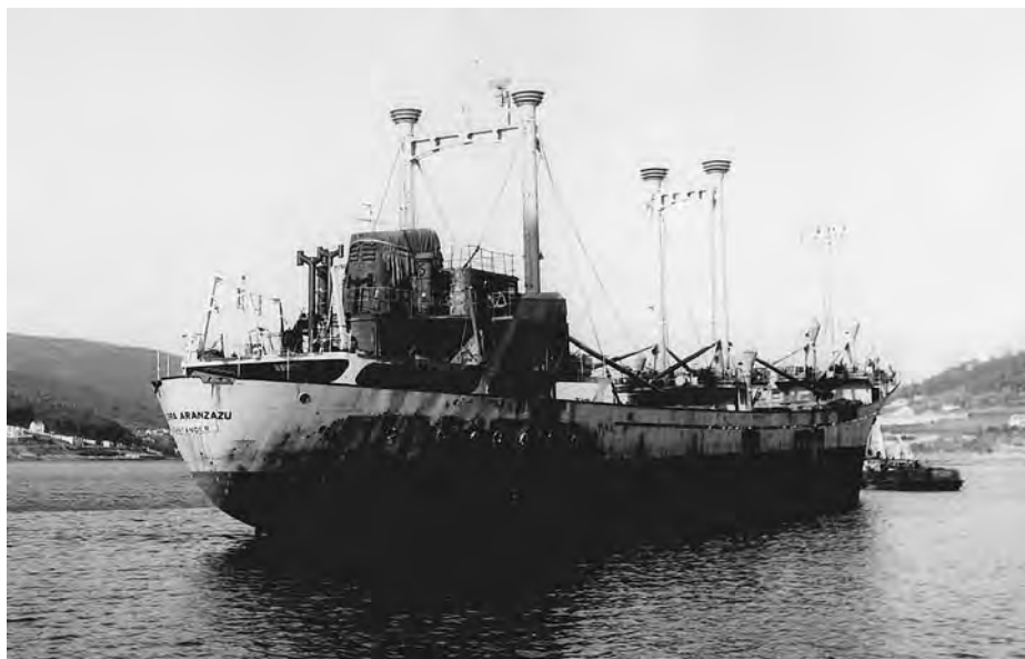
El aspecto que presentaba el Sierra Aránzazu entrando en Corcubión. (Revista Oficema ).

Al poco tiempo de llegar a la bahía de Nipe comenzaron los trabajos de salvamento, que duraron dieciséis días. Primero sofocaron los incendios, gracias al trabajo de unos hombres que lucharon duramente contra el humo y el calor, presentando el Sierra Aránzazu un aspecto lamentable, escorado a babor y apoyado sobre el fondo a causa de las 3.000 toneladas de agua que