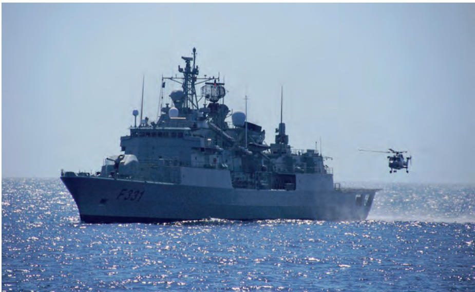
Fragata Alvares de Cabral , que tomó parte en la Operación OCEAN SHIELD.

La operación OCEAN SHIELD viene a dar continuidad a las operaciones ALLIED PROTECTOR —que transcurrió del 24 de marzo al 16 de agosto del