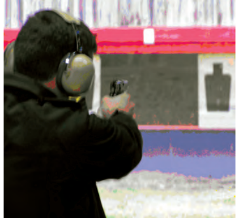
Prácticas de tiro.

Tipo C: para personal de seguridad privada debidamente habilitado para uso de armas. El ejemplo más común es el escolta privado o el vigilante de seguridad habilitado para el uso de armas. Tiene una vigencia de cinco años. Estas armas no pueden salir del ámbito de la empresa de seguridad.