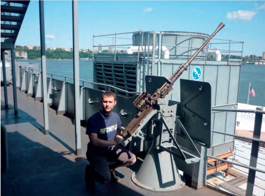
Armamento de guerra.