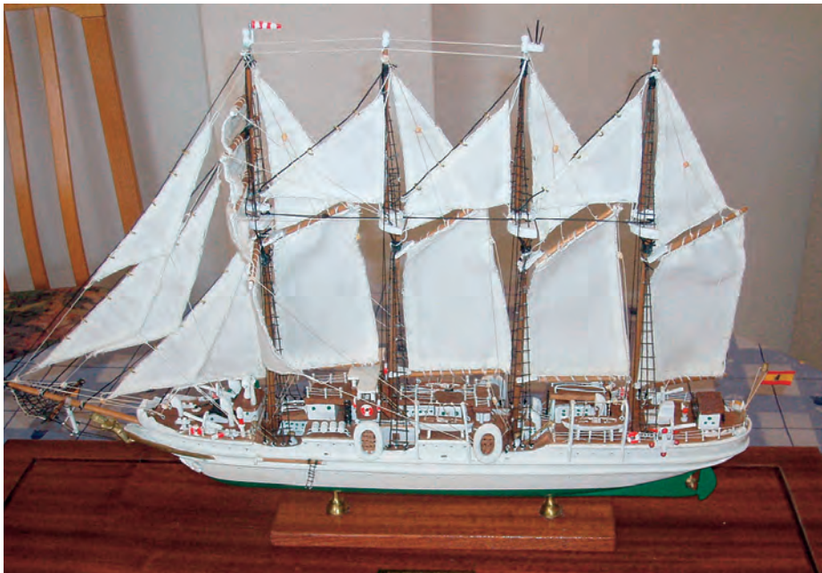
Mi primera maqueta.