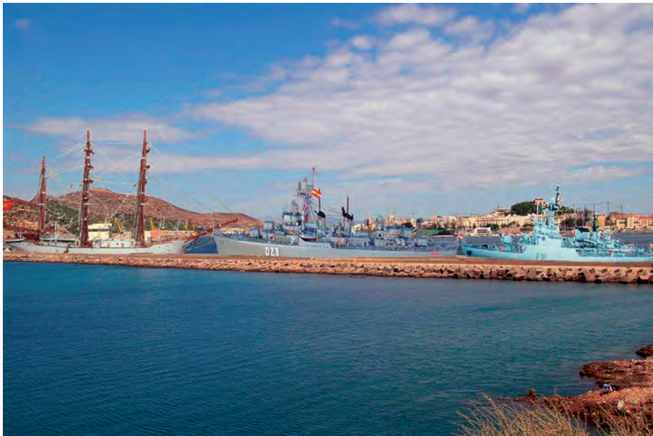
Montaje fotográfico de maqueta.

tienen esta afición, tan nuestra, y he tomado como referencia una de las secciones de nuestra REVISTA GENERAL DE MARINA, como es la del Pañol de Pinturas , a través de la cual vamos conociendo personas vinculadas a la Armada que disfrutan dedicando parte del tiempo a un bonito hobby . Sería bonito que por medio de la REVISTA nuestros maquetistas pudiesen dar a conocer sus modelos, principalmente los dedicados a unidades de nuestra Armada, explicando a su vez sus experiencias, anécdotas y técnicas relacionadas con el maquetismo.