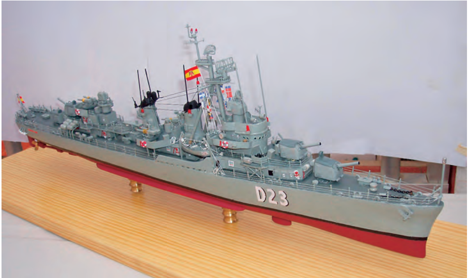
Destructor Almirante Valdés .