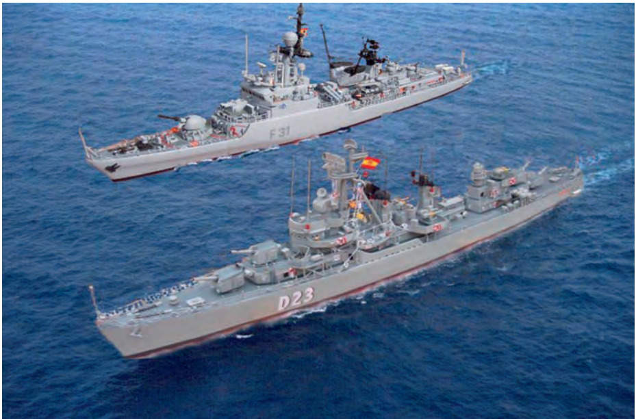
Montaje fotográfico de maqueta.