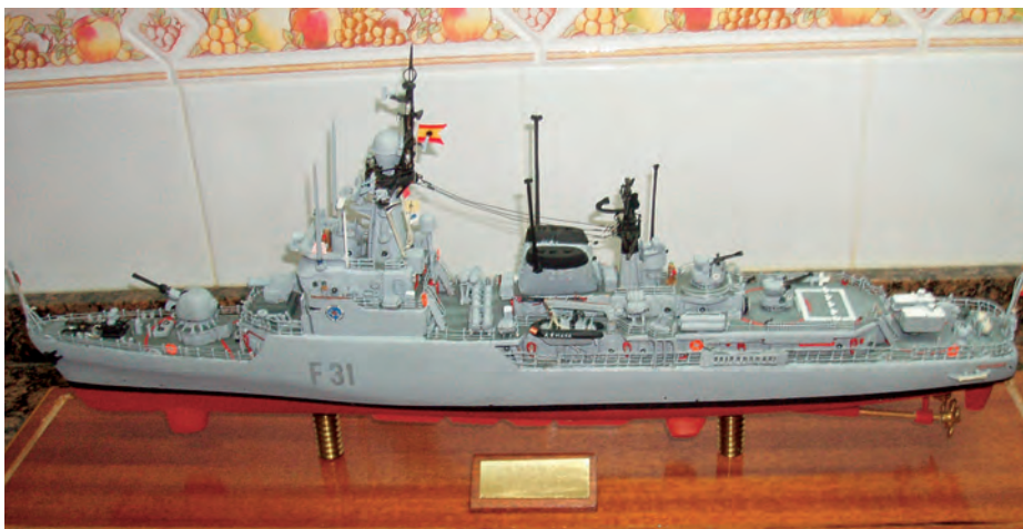
Corbeta Descubierta .