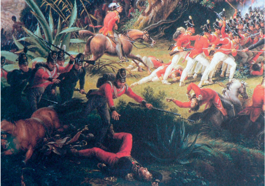
Lejeune. Bataille de Chiclana (detalle).

La escena central del cuadro Bataille de Chiclana. 5 Mars 1811 representa el momento del duro enfrentamiento sostenido en la Loma del Puerco por franceses y británicos. En el lado inferior izquierdo figura el general Ruffin, quien yace inerte, tendido en el suelo junto a su caballo y a punto de ser capturado por soldados enemigos. Destacan en él su figura corpulenta y elegante, así como la tez clara del rostro rodeado por los rizos de un pelo rubio en desorden. En la composición aparece la vivandera Catherine Balland recorriendo las filas en los momentos más peligrosos de la batalla, distribuyendo aguardiente a los soldados para reconfortarlos, a la vez que los animaba diciéndoles: « Tiens, bois, bois, mon brave; tu me paieras demain » (17). Catherine, que llegó a ser célebre en el Ejército francés, recibió por la acción referida y por otras semejantes la Cruz de la Legión de Honor en 1813.