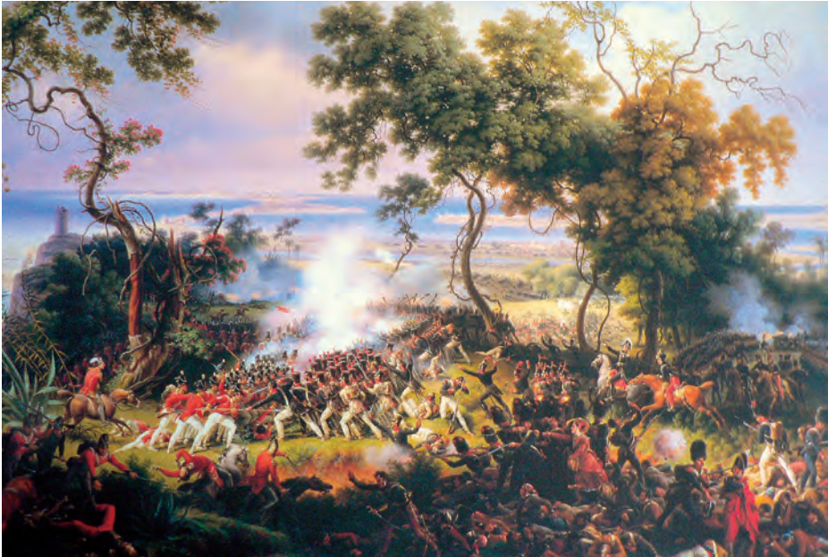
Lejeune. Bataille de Chiclana. 5 Mars 1811.

jos de fortificación, acompañándole en recorrer toda la línea francesa de operaciones, bajo el fuego de las baterías y cañoneras españolas.