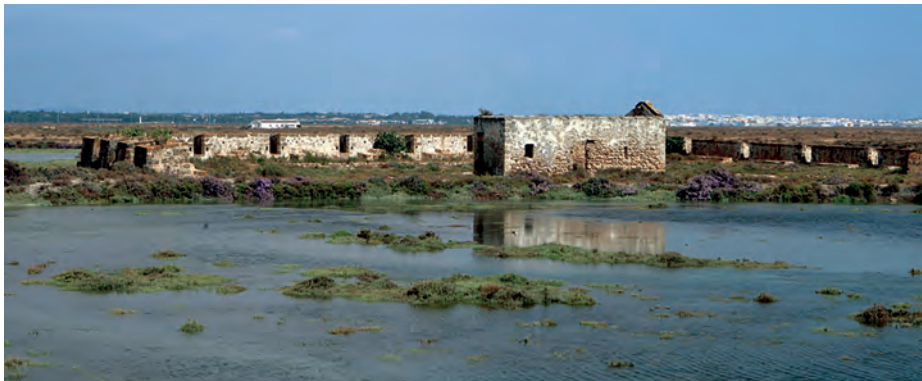
Fortificaciones españolas defensoras de la cabeza del puente.

En aquellos días, las fuerzas del 1. er Cuerpo quedaron reducidas a 13.580 combatientes, distribuidos del modo siguiente: 3.300 sobre la línea en los reductos, 2.350 en Medina-Sidonia, y 7.930 disponibles para marchar de inmediato sobre el enemigo. La División Ruffin poseía alrededor de 4.000 hombres, de los cuales sólo podía contar con 2.400 disponibles: el 9. o Regimiento tenía unos 600 hombres en los reductos y 400 disponibles; el 24. o Regimiento contaba con alrededor de 800 combatientes para acudir al campo de batalla; el 96. o Regimiento estaba en torno a los 1.200 efectivos, de los cuales 600 se hallaban disponibles, y los restantes en Medina-Sidonia; los 400 integrantes de los granaderos del 3. er Batallón estaban todos disponibles, así como los 200 dragones del 1. er Regimiento, mientras que los 400 componentes de los cazadores del 3. er Batallón se encontraban también en Medina-Sidonia (10).