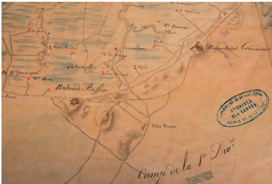
Línea de fortificación francesa. Plano francés de 1810.