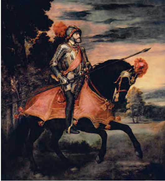
Carlos V a caballo en Mühlberg. Óleo sobre lienzo. Tiziano, 1548. (Museo del Prado. Madrid).

ciente de la importancia estratégica y económica que suponía encontrar o abrir una vía marítima entre ambos océanos, ordena al gobernador de Panamá «que habiendo sido informado de que el río Chagres que entra en la mar del Norte se puede navegar con carabelas cuatro o cinco leguas, y otras tres o cuatros en barcas y que de allí al mar del Sur puede haber cuatro leguas por tierra, vayáis a ver la dicha tierra que hay del río Chagres a la mar del Sur y veáis que forma y orden se podrá dar para abrir la dicha tierra para que abierta se junte la mar del Sur con el dicho río, de manera que haya navegación, y que dificultades tiene así por la menguante de