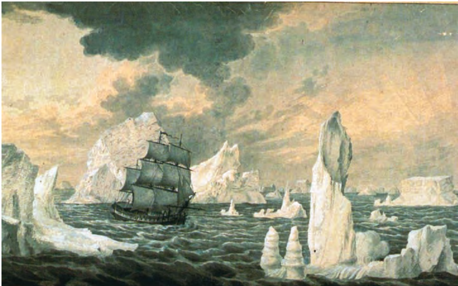
La corbeta Atrevida entre bancas de nieve el día 28 de enero de 1794. (Fernando Brambila. Museo Naval).

Liquidado el conflicto con Marruecos, y tras la marcha del ministro Esquilache, se entendió como momento adecuado para infligir una dura lección a la eminencia gris de aquella guerra, el bey de Argel. España preparó una expedición con casi cuatrocientos buques y atacó la rada argelina, pero la operación resultó un completo fracaso y, al decidirse el reembarco, Malaspina participa activamente en la penosa empresa de evacuación de los heridos, reintegrándose a su navío más tarde.