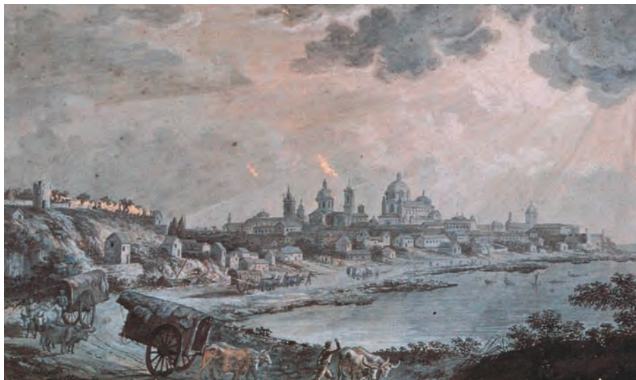
Buenos Aires desde el camino de las Carretas. (Fernando Brambila. Museo Naval)..

Promovido a alférez de navío, de diciembre de 1777 a septiembre de 1797 realiza su primer viaje oceánico a bordo de la fragata Astrea , que manda el capitán de navío Antonio Mesía. El puerto de destino era Manila, capital del más lejano territorio hispano, y su retorno se hizo por la ruta del cabo de Buena Esperanza. Más de siete meses se emplearon en el viaje de ida y casi ocho en el de vuelta. Cinco y medio fueron también los meses que duró la estancia en Manila en espera de la estación de vientos favorables.