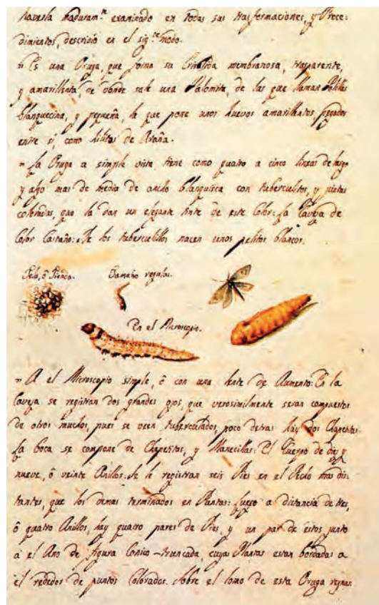
Página de un diario autógrafo de Malaspina.

retoños alcanza la mayor fama». No fue aventurado su juicio. Como hombre de vasta cultura, abierto a los problemas socioeconómicos de su tiempo, se hizo intérprete de la inminente transformación de la sociedad.