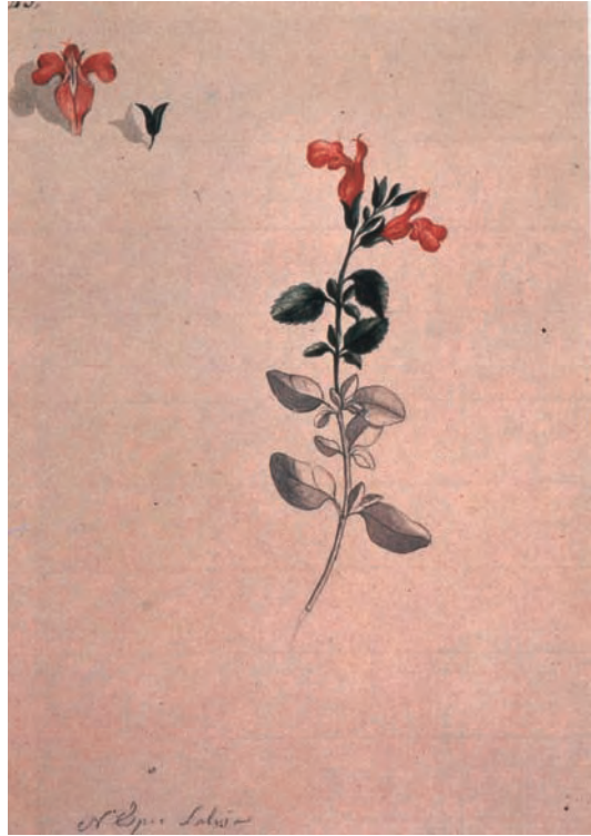
Salvia de México. (F. Lindo. Real Jardín Botánico).

Nuevas y meritorias singladuras esperan a Malaspina en su nuevo empleo. Al mando de la fragata Asunción realizó un viaje a Manila y a otros puntos de aquellos lejanos mares, regresando a España en 1784. Permaneció poco tiempo de teniente de la Compañía de Guardias Marinas de Cádiz. En 1786 realizó un nuevo viaje a Manila con la fragata Astrea a través del cabo de Hornos, dando la vuelta al mundo al regresar por el cabo de Buena Esperanza. Y de nuevo en Cádiz en 1788, salió de este puerto a finales de julio de 1789 con las corbetas Descubierta y Atrevida . Son los prolegómenos de la famosa expedición científica; de un increíble viaje de sesenta y dos meses, donde se mezclaron las exploraciones científicas, marítimas e incluso políticas por las Américas y el Pacífico.