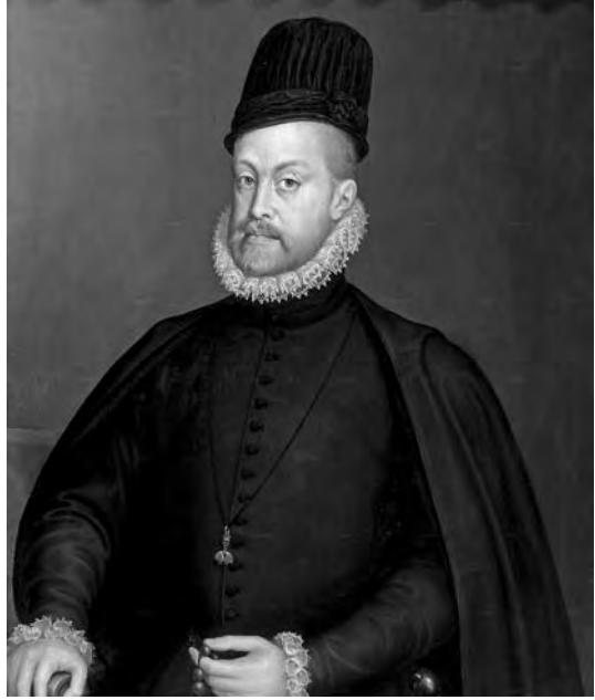
Felipe II por Alonso Sánchez Coello (1557). (Kunsthistorisches Museum. Viena).

Decidida la acción, Felipe II ordenó acelerar los preparativos para invadir el país vecino. La preocupación del monarca español era buscar las personas encargadas de mandar las fuerzas españolas. Sancho Dávila, uno de los mejores generales que sirvió bajo las órdenes del duque de Alba, sugirió al rey que las fuerzas terrestres recayeran en el duque de Alba, y que don Álvaro de Bazán, marqués de Santa Cruz, asumiera el mando de la Armada. Ambos