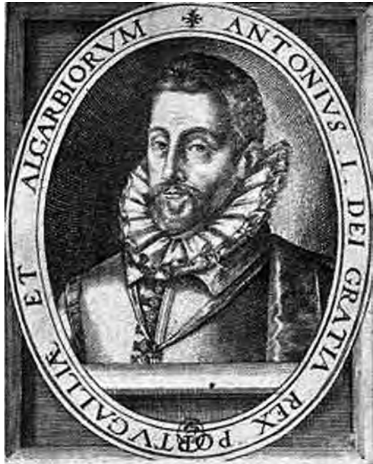
Don Antonio, prior de Crato.

Vencido el último pretendiente y ocupado militarmente el país, Felipe II llegó a Lisboa en la primavera de 1581 para tomar posesión del trono. Las cortes portuguesas se reunieron en Tomar el 15 de abril de 1581 y declararon a Felipe II rey de Portugal con