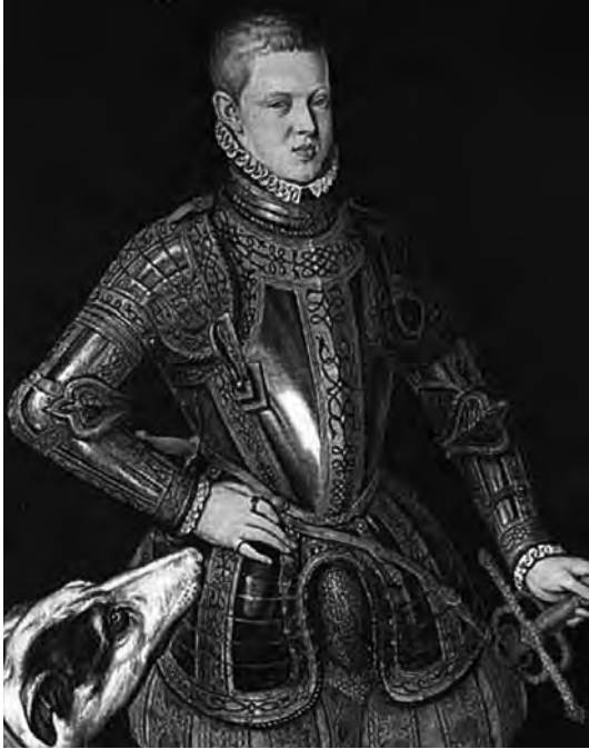
Don Sebastián. Rey de Portugal, 1554-1578.

Felipe II consideró que tenía derecho a ocupar el trono, y lograrlo supondría la consecución de un importantísimo objetivo político, como era la reunificación de dos grandes imperios: España y Portugal. Pero para alcanzarlo era necesario imponer los derechos sucesorios sobre sus rivales. La corona de Portugal tenía entonces muchos candidatos, pero de todos ellos ninguno con tantas razones de sangre como el rey de España Felipe II, tío del difunto monarca y nieto del rey don Manuel. Dos eran los pretendientes portugueses con mayores posibilidades: Catalina de Braganza, nieta de Manuel I, y don Antonio, prior de Crato, personaje pintoresco, hijo bastardo del infante don Luis y nieto de don Manuel de