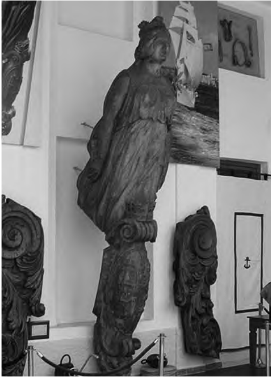
Original del mascarón de proa del Juan Sebastián de Elcano . (Museo Naval de San Fernando).