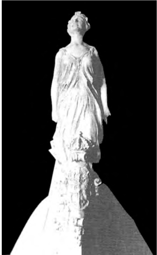
Frontal del modelo a escala del mascarón (1926).

Paralelamente a las maniobras del astillero, el Negociado de Campaña había recogido la propuesta de la Intendencia General (42) y pidió que la Comisión Inspectoras (43) desglosara los costes de la figura, diferenciados de los otros adornos pactados en la contrata con Echevarrieta. Era el momento para que el empresario moviera los