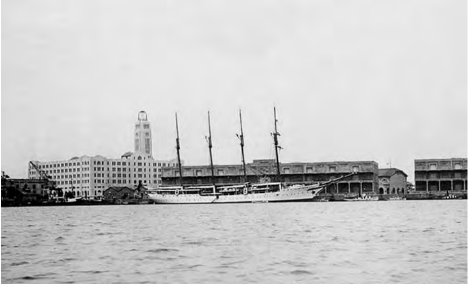
Primer crucero del Juan Sebastián de Elcano . Montevideo, 1928.