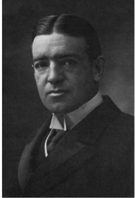
Ernest Henry Shackleton

pavías (4) argelinas en aguas de Barcelona. Ascendido a teniente general de la Armada en 1810, fue elegido miembro del Consejo de Regencia de España e Indias. Murió en 1814, pocos días después de ser nombrado capitán general de Cartagena, cargo del que no llegó a tomar posesión.