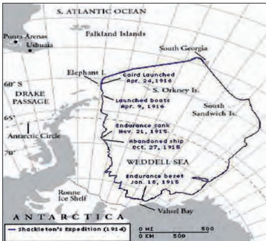
Mar de Weddell.

un viaje épico en trineos, construidos con los botes del propio Endurance , atravesando el helado mar de Weddell. Mientras se trasladaban, los hielos en movimiento contribuyeron a acercarlos a su destino y posteriormente tuvieron