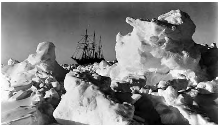
El Endurance atrapado en el hielo.

El 1 de marzo de 1915, con el Endurance casi totalmente cercado por el hielo, el sol desapareció por completo, y no se le vio durante los cuatro meses siguientes. Esto redujo aún más las actividades de los expedicionarios: