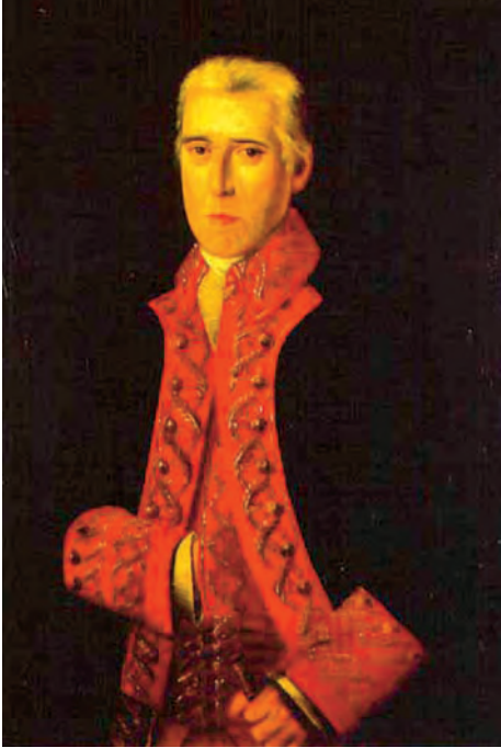
Antonio de Escaño.