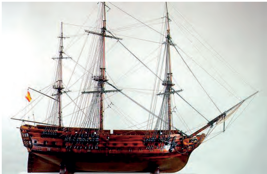
Navío San Ildefonso (1785-1805).

En mayo de 1802, al regreso de la escuadra a Cádiz, tras treinta y cinco meses desde su última salida, Escaño fue de los primeros en volver a navegar para llevar a sus reyes a Nápoles: