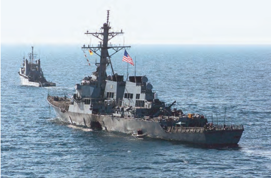
USS Cole .