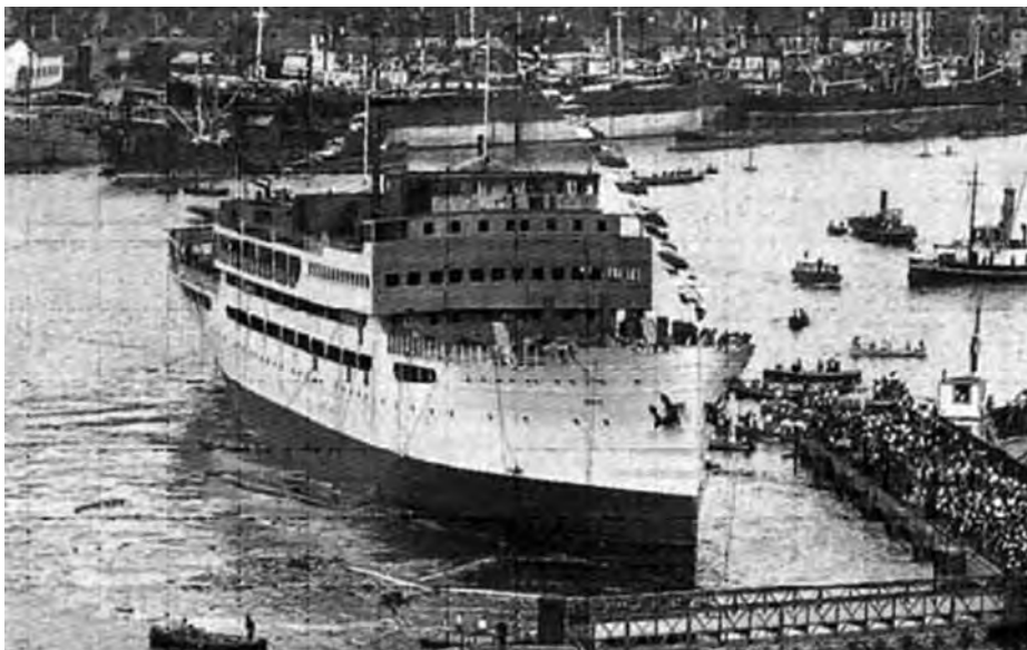
Botadura buque Dómine . (Archivo Compañía Trasmediterránea).

Algunos de los buques de la naviera eran muy antiguos y escasamente rentables, por lo que fueron retirados del servicio; esto les sucedió al Balear , Canalejas , Jorge Juan y Peris Valero (los dos últimos pertenecientes a Isleña Marítima). El Marqués del Turia , también de esta última naviera, fue vendido al naviero bilbaíno Escudero. Los naufragios del Río Cabriel y Teide , sucedidos en 1932, y la necesidad de incorporar dos buques a la línea de Fernando Poo por imperativo del contrato con el Estado aceleraron los planes de renovación de la flota que ya se habían iniciado.