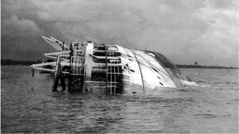
El Fernando Poo hundido en Guinea. (Archivo Francisco Sánchez).

exista compensación posible para el quebranto que ocasiona la tardanza en servir las líneas que han de ser cubiertas con esos dos buques, los más costosos y de más categoría de la flota de la Compañía».