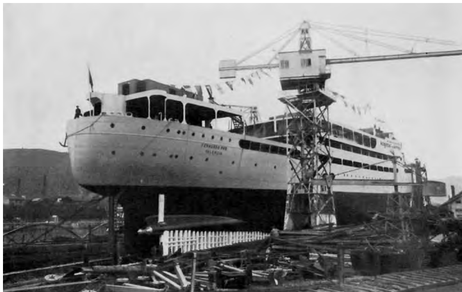
El Fernando Poo preparado para su botadura.

la subvención del 6 por 100, subvención que este segundo año del contrato es de 20 millones de pesetas para un capital total de 52 millones».