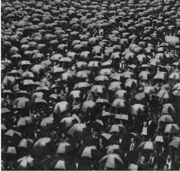
Manifestación de los obreros de la Unión Naval de Levante para que los dos buques de la Compañía Trasmediterránea se construyeran en su factoría. Revista Crónica de 24 julio de 1932. Año IV. Núm. 141.

para contratar se tomaban muchas veces decisiones equivocadas. Y admitía que cuando aceptó a instancias del Gobierno que esos buques se construyeran en los astilleros vascos era consciente de que realizaba un acto de mala administración, ya que lo correcto hubiera sido que se construyeran en unos astilleros propiedad de la naviera. Se lamentaba el presidente que aunque sólo se hubiera construido uno de los buques en la Unión Naval de Levante hubiera asegurado trabajo a esos astilleros para veinte meses. Por ello, aconsejaba la ne-