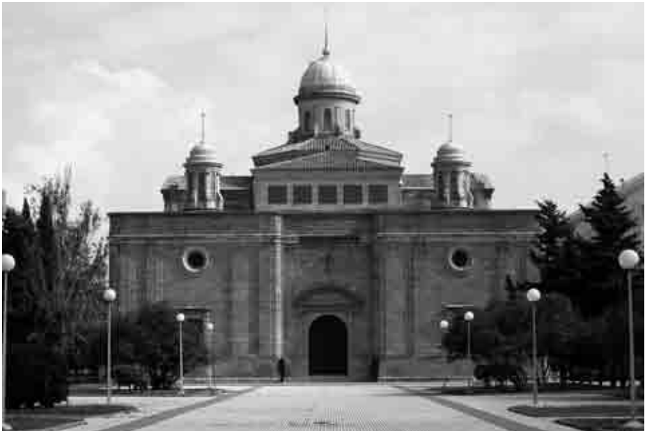
Panteón de Marinos Ilustres, San Fernando (Cádiz).

Tras hacerse pública esta controvertida decisión, cuestionada por no pocos vecinos que manifestaron su expreso deseo de mantener el nombre original en el callejero municipal, el