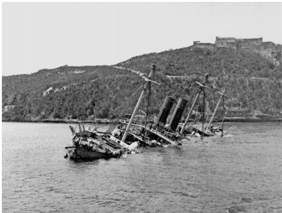
El Reina Mercedes hundido en la entrada de la bahía de Santiago.

ataque del enemigo, mientras el resto de los buques quedaba en el interior del puerto y listo para cualquier eventualidad.