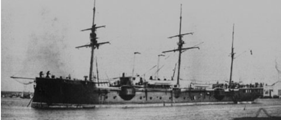
El crucero de la Marina española Reina Mercedes (junio de 1898).

otros dos se montaron en Punta Gorda al mando del alférez de navío Vial. Además se colocaron en la parte exterior del puerto un cañón de 57 mm, cuatro de 70 mm y una ametralladora en la parte baja de la Socapa, al mando del teniente de navío Camino. Al igual que la artillería, una parte importante de la dotación, 300 hombres, fue desembarcada. Los restantes que permanecieron a bordo fueron los que llevaron la peor parte, dado que muchos de ellos murieron por ser un blanco fácil de la potente artillería de los buques estadounidenses.