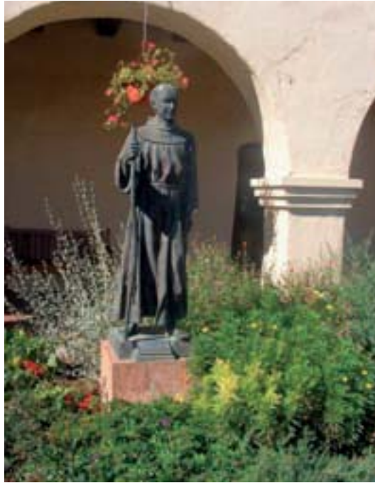
Fray Junípero Serra.

Gaspar de Portolá desembarcó en San Diego y dos días después se les unió la expedición terrestre del padre Serra, quien fundó la misión de San Diego de Alcalá el 16 de julio de 1769. Sin embargo, antes de finalizar las obras decidió cambiar la ubicación debido al maltrato de los soldados a los indígenas. La nueva situación de la misión se encuentra en un área aún hoy en día llamada Mission Valley.