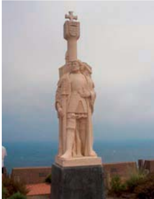
Monumento a Rodríguez Cabrillo.

Coincidiendo con la celebración de los 400 años del descubrimiento del Nuevo Mundo, en 1892 varias sociedades portuguesas asentadas en California obtuvieron el reconocimiento oficial de que Juan Rodríguez Cabrillo fue el descubridor de California e impulsaron los planes para la construcción de un monumento que perpetuara su memoria. Así el 14 de octubre de 1913, mediante una proclamación presidencial, se crea el Monumento Nacional a