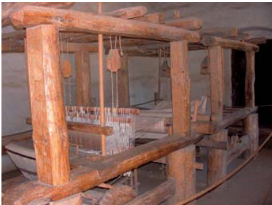
Telar en la misión de la Purísima Concepción.

Durante los siguientes quince años se fundaron nueve misiones, todas ellas bajo la dirección del padre Serra. La forma de hacerlo siempre fue igual: se elegía un lugar adecuado, se levantaba una capilla, unas cabañas para residencia de los frailes y un pequeño fuerte protector. Se ganaba la confianza de los indígenas, que se acercaban movidos por la curiosidad, y les invitaban a establecerse en las proximidades.