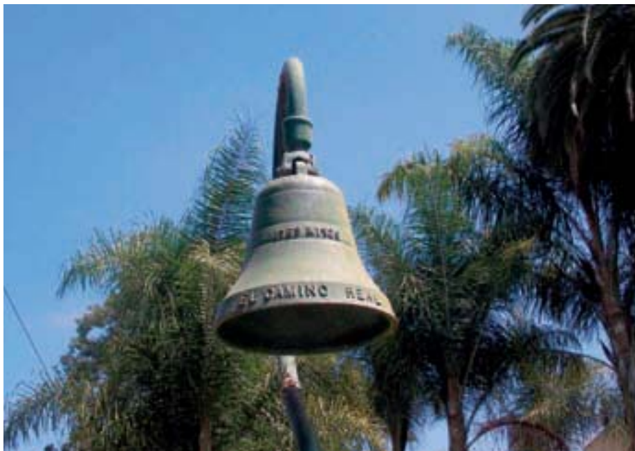
Típica campana del Camino Real.

tierra fuese fértil. La distancia quedó establecida en treinta millas (48 kilómetros), que era una jornada a caballo. Al camino que las unía se le llamó el Camino Real, que comienza en San Diego y finaliza en San Francisco, a unos 1150 kilómetros al norte. La tarea era ardua pues el camino debía ser ensanchado y allanado. Hoy en día la Ruta 101 recorre la mayor parte de este camino. En 1906 se creó la Asociación del Camino Real y se decidió marcar la ruta original con una imitación de las campanas de las misiones colgadas en unos bastones que se asemejaban a los usados por los franciscanos. El camino fue completamente marcado en 1913 con una campana a cada milla y una en cada misión. A lo largo de los años se han perdido muchas, otras fueron donadas y todavía las podemos encontrar a lo largo de la carretera.