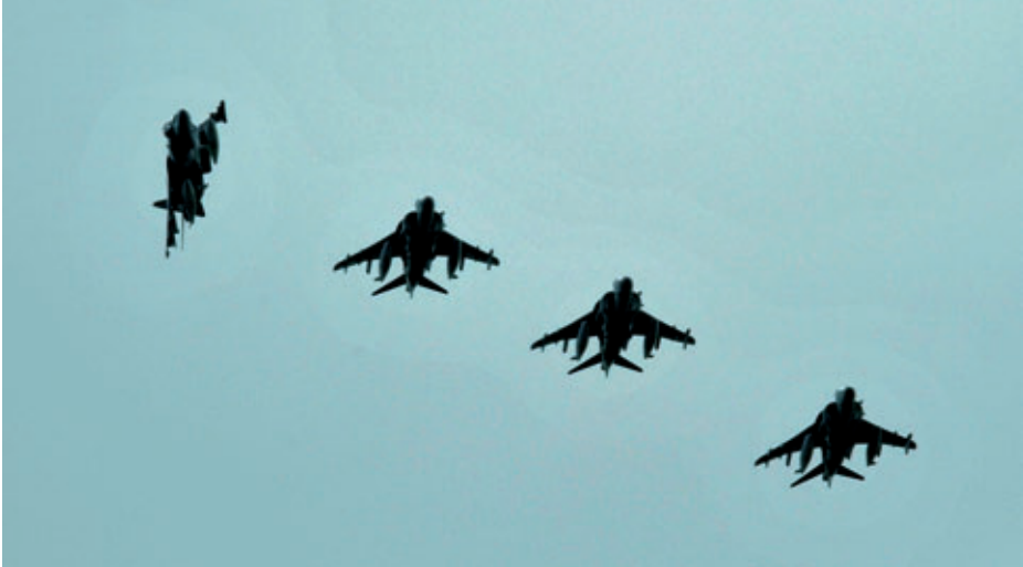
Harrier en la Armada 2013+: ¿más razones para continuar que para romper?

gación posterior o autoridad para administrar dichos fondos. La gestión de los fondos se delega al Departamento de la Navy (DoN) desde NAVAIR-PMA257 AV8B JPO.