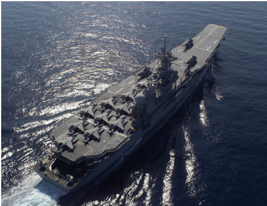
Príncipe De Asturias + AV8B: poder naval (2).