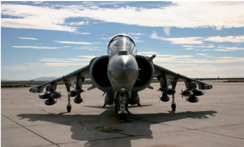
AV8B Plus con bombas dotadas del kit JDAM (Joint Direct Attack Munition).