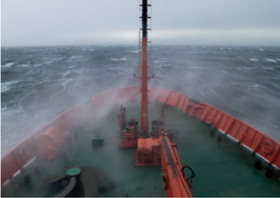
BIO Hespérides en Campaña Antártica 2012-13.

científicos de distinta nacionalidad (que ya se practica) pudiera ser también una buena manera de reducir costes, siempre que estos se repartan equitativamente.