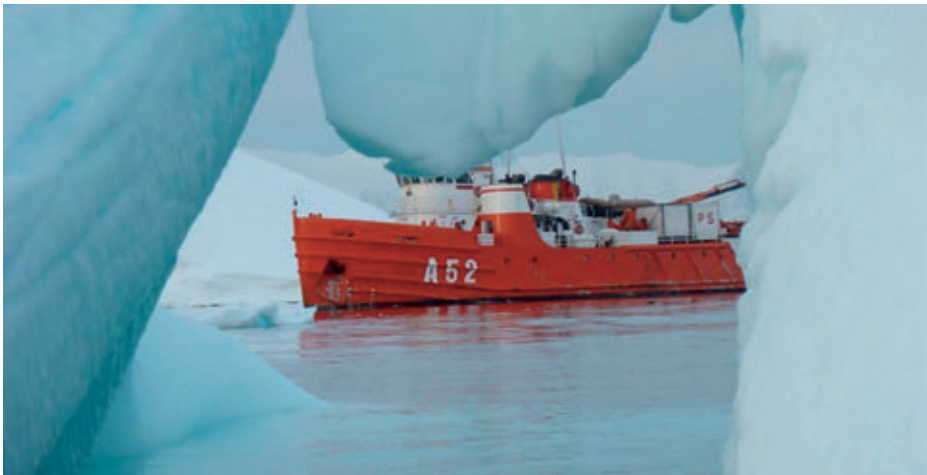
BIO Las Palmas.