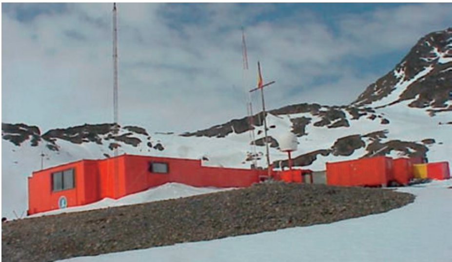
La Base Juan Carlos I en la isla Livingston.