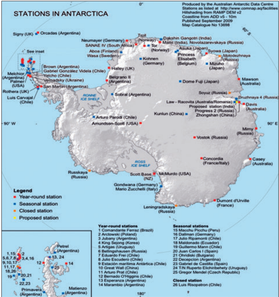
Bases científicas en la Antártida.

La base más antigua es la argentina de las Orcadas del Sur, en la isla de Laurie, instalada en 1904 y que continúa abierta. Argentina, Chile, Reino Unido, Estados Unidos y Rusia son naciones que mantienen más bases científicas operativas.