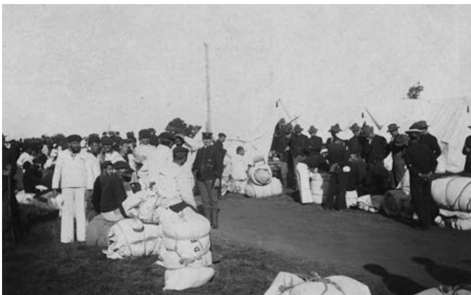
Momento del regreso de los españoles antes de embarcar en el City of Rome .

Según establecen las noticias del New York Times del día 2 de septiembre, los capitanes de navío Eulate y Concas habían estado el día anterior en Nueva