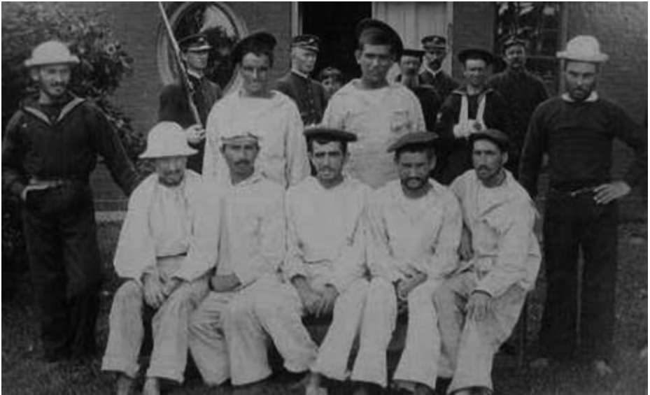
Dos momentos de la vida del campo.

York intentando contratar el buque. Tenían previsto inspeccionar el Miguel Jover y el Catalina , que habían sido apresados por los americanos, para regresar a España.