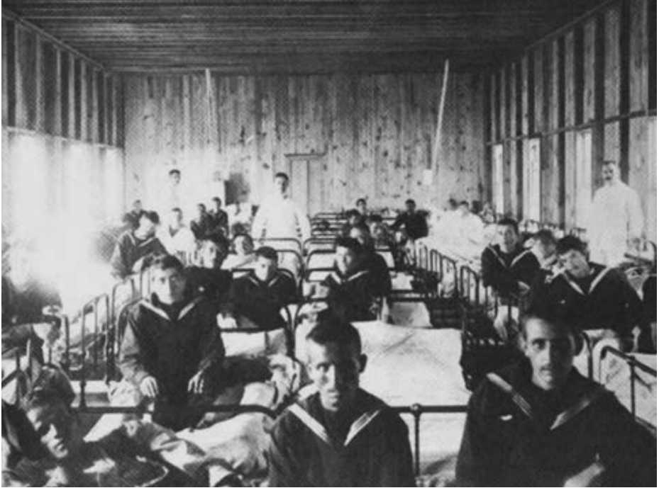
Fotografía de la colección del autor que muestra la enfermería del Camp Long.

En el City of Rome embarcaron dos generales, ocho jefes, 70 oficiales y guardias marinas, 1.574 clases y marinería, dos oficiales del Ejército de Tierra y 21 soldados. El día 12 Cervera comunica al ministro su salida desde Portsmouth, donde habían recalado para recoger a todos los prisioneros, y pide que se pasaporte a los jefes y oficiales para sus casas: «Salimos. — Probable llegada [el] 21—. Suplico instrucciones para que Comandante Marina pasaporte Jefes [y] Oficiales para sus casas, excepto los que, nombrados por mí, llevan inmediato cargo expedición» (6).