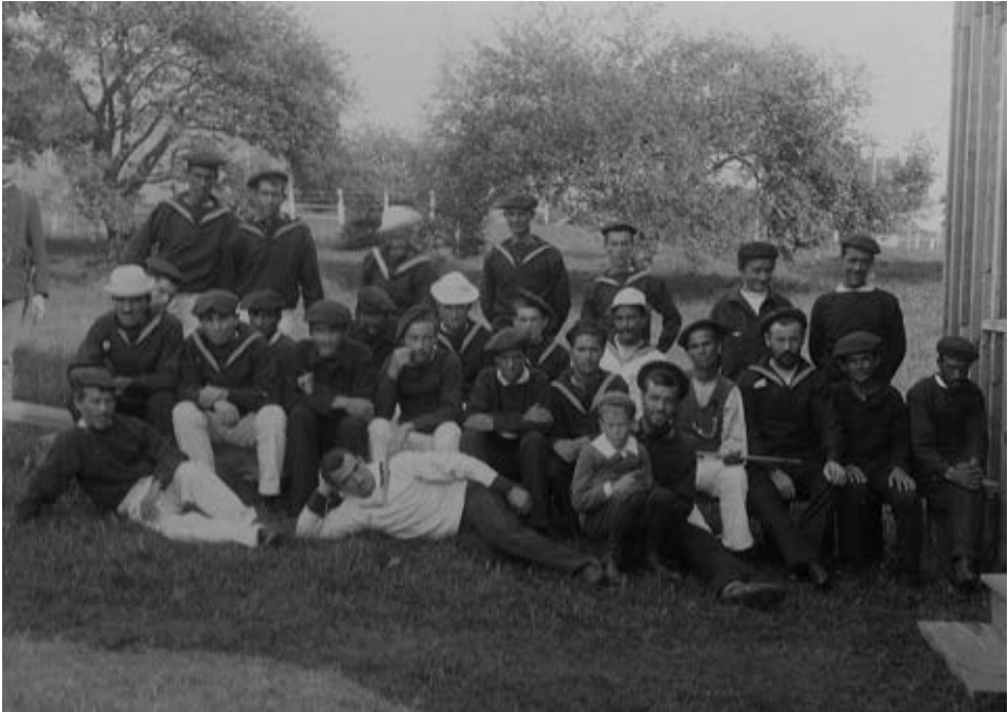
Otra imagen de nuestro protagonista en el campo de prisioneros norteamericano.

El representante norteamericano en el acto fue el contralmirante Austin M. Knight, mientras que el español fue el agregado militar, coronel Nicolas Urkullu. El 12 de abril embarcaron en Portsmouth los restos de los prisioneros españoles en el transporte de la Armada, en un emotivo acto, con presencia de compañías de los buques USS Washington , USS Sacramento y USS Southery .