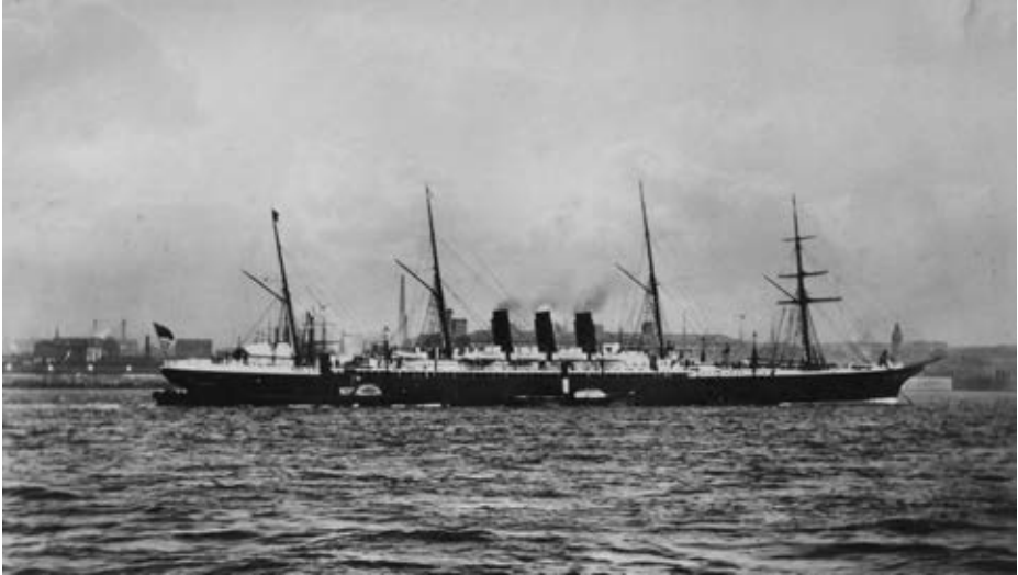
Fotografía del trasatlántico City of Rome .

Al día siguiente, Cervera (Almirante) responde al mensaje del ministro del día 1, dándole cuenta del buque contratado: «Comisión que envié New-York ha contratado transporte gente por 11.185 libras, pagaderas á la vista en Londres, orden Krajewski Pesant y C a Giro contra la Comisión de Marina. Avisaré salida» (3).