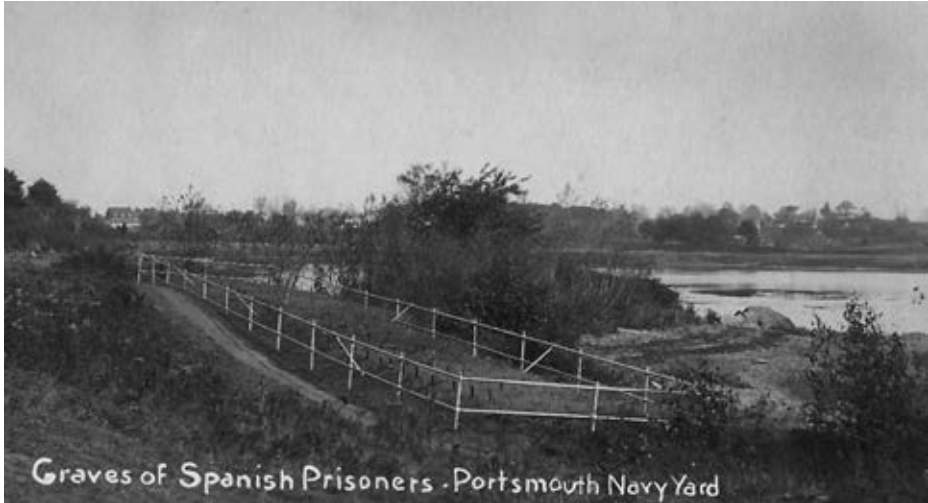
Sepulturas de los prisioneros españoles en Camp Long.