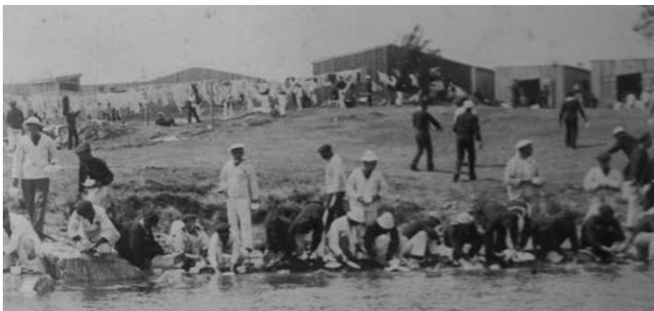
Momento de la vida diaria del campo. Fotografías tomadas desde la mar; la estancia de los españoles en el campo fue un «atractivo turístico».

También establecen que contactaron con una línea alemana, la Bowling Green, pero no tenía ningún buque disponible. Ese día comieron con algunos directivos de la compañía Krejewski, Pesant & Co., que había hecho las reparaciones necesarias del Vizcaya durante su anterior estancia en Nueva York en febrero de ese año. La noche la pasaron en Boonton, Nueva Jersey, regresando a Annapolis en tren en la tarde del día 2 (2).