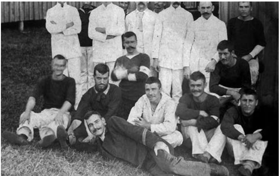
Fotografías de los enfermeros españoles y americanos en el campo en Portsmouth.