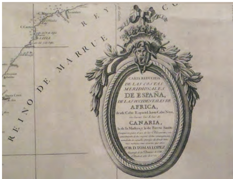
La tarjeta de la carta.

«Presa de un Convoy Ynglés destinado a las Yndias Orientales y Occidentales hecha por la Escuadra combinada de España y Francia al mando del Director General de la Armada Don Luis de Córdoba el día 9 de agosto. En que habiendo logrado escapar el Navío y dos Fragatas de guerra de su Escolta, con otros tres Buques, se apresaron las cuarenta y cinco restantes de que constaba».