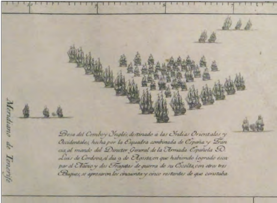
El apresamiento tal como aparece en la carta.

lamente a la graduación de las latitudes: en el marco este, en leguas españolas de diecisiete y media en grado, y en el marco oeste en leguas marítimas de Francia e Inglaterra de veinte en grado.