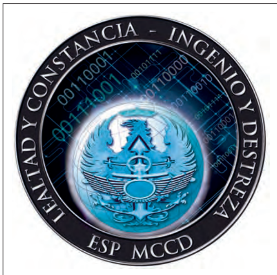
Emblema del Mando Conjunto de Ciberdefensa (MCCD).

En lo que se refiere a la respuesta orgánica, España ha dado ya un primer y decidido paso con la reciente creación del Mando Conjunto de Ciberdefensa (MCCD), ubicado en la madrileña base de Retamares y que alcanzó su IOC ( Initial Operational Capability ) en septiembre de 2013.