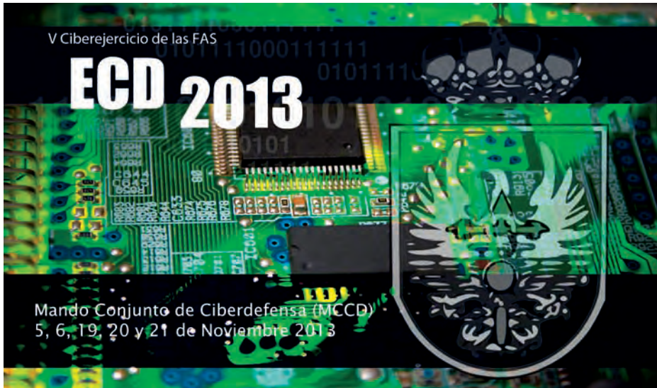
Cartel del Ejercicio de Ciberdefensa 2013, dirigido por el MCCD.

Para apoyar esta aseveración (y, quizás de paso, modificar algún mal hábito y, en consecuencia, reducir algún «ciberriesgo» potencial) he preparado algunos ejemplos ilustrativos. Ejemplos que van avanzando en complejidad, que protagonizan desde usuarios de lo más corrientes hasta autoridades con elevadas responsabilidades, y que, aunque inventados expresamente para este artículo (2), creo que presentan situaciones que pueden ocurrir perfectamente en cualquier momento, o que hasta puede que hayan ocurrido ya en un formato similar. Y no debemos olvidar que la realidad casi siempre acaba por superar a la ficción.