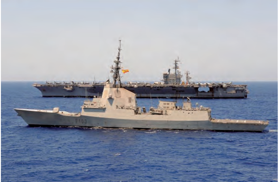
Fotografía de la fragata Blas de Lezo y del USS Ike Eisenhower durante el despliegue.