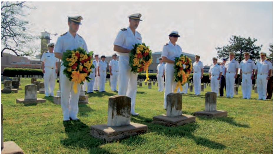
Momento de poner las coronas en las tumbas de los miembros de la Armada en el cementerio del Hospital Naval de Norfolk.