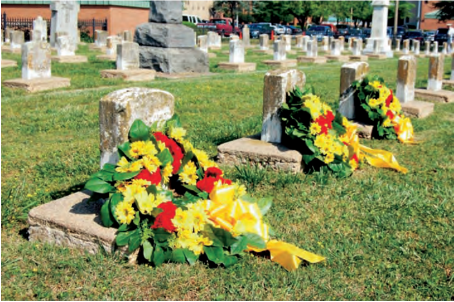
Las tumbas de los tres españoles tras el homenaje.