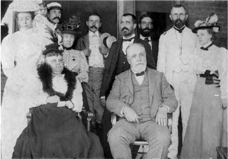
Fotografía del almirante Cervera con el director del Hospital Naval de Norfolk y su familia, así como médicos de la Escuadra y el hijo del almirante, Ángel Cervera, en su visita del 5 de agosto.

El día 7 de septiembre los marinos españoles convalecientes embarcaron en el vapor de ruedas Old Dominion , de la compañía Old Dominion Steamship Line, para ser trasladados a Nueva York al objeto de embarcar en el City of Rome .