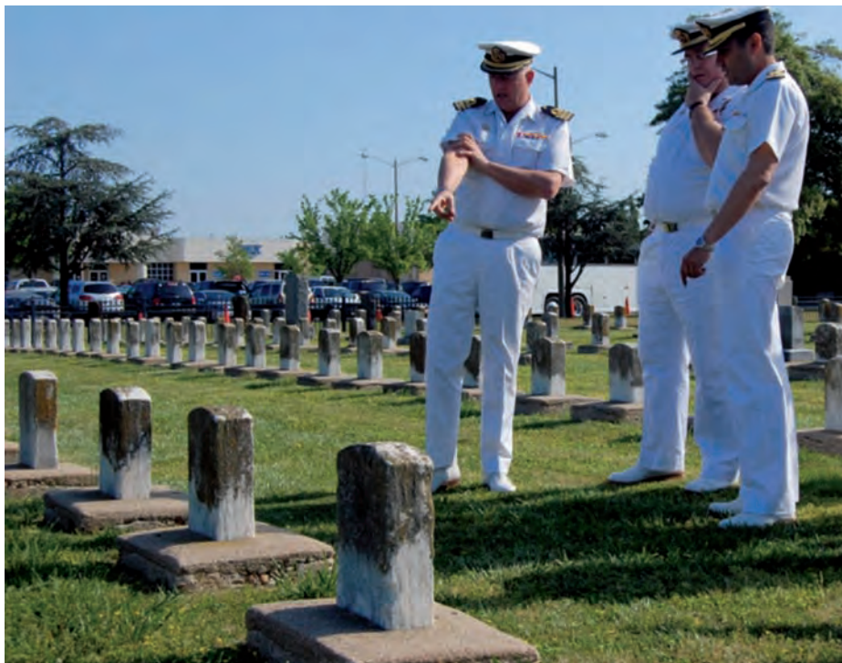
Sepulturas de los tres marineros españoles en el Hospital Naval de Norfolk.