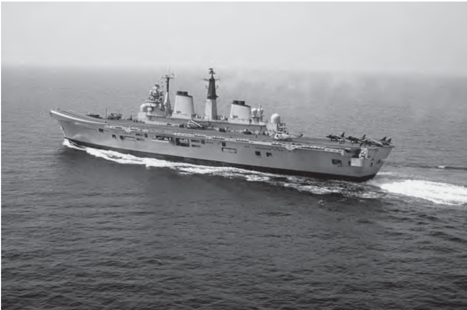
HMS Invincible en 1990. (Autor: PH1 TurnerII. http://en.wikipedia.org/wiki/File:HMS_Invincible_(R05)_Dragon_Hammer_90.jpg ).