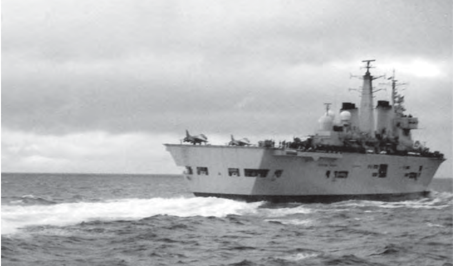
HMS Invincible en la zona de exclusión total, 1982..

A continuación atacó el alférez Isaac disparando sus cañones y lanzando sus bombas hacia la isla del portaaviones, virando a la derecha para evitar el barco y descendiendo a su vez a ras del agua y poniendo rumbo hacia los «Chanchas». «A medida que se alejaba, pudo observar que el portaaviones había quedado totalmente oculto detrás de capas de humo negro» (2).