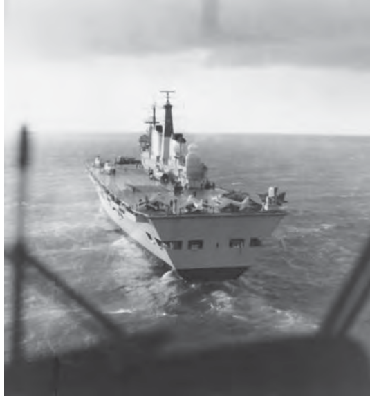
HMS Illustrious del tipo Invincible .

La segunda se produce cuando el Ministerio de Guerra británico desmiente, el 3 de junio, la versión anterior, y la corrige diciendo que el buque atacado era la fragata Avenger , y que este buque había derribado dos aviones argentinos con misiles Sea Dart (la Avenger no estaba equipada con misiles Sea Dart, pues era una fragata Tipo 21 ) (4). Esta versión es algo parecida a la que expone el almirante Woodward en el libro One Hundred Days , aunque en este caso los aviones son derribados por un misil del Exeter y el cañón de la Avenger .