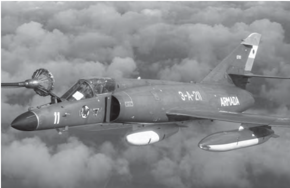
AMDBA Super Etendard 3-A-211 reabasteciéndose en vuelo.

En el briefing previo al vuelo se había establecido que la misión seguiría adelante si tenían que regresar, por avería, uno o dos aviones A-4C. Solamente