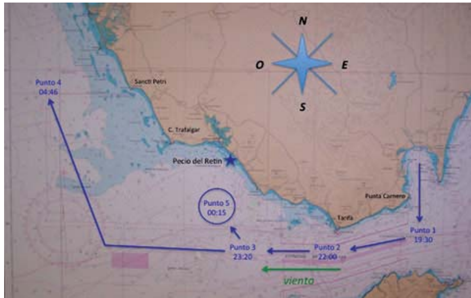
Gráfico 2. Derrota de la escuadra aliada. (Estimación del autor).

...At 1215 AM, July 13th, the Real Carlos blew up, and fifteen minutes later, the San Hermenegildo ablaze from stem to stern, suffered the same fate...» (8).