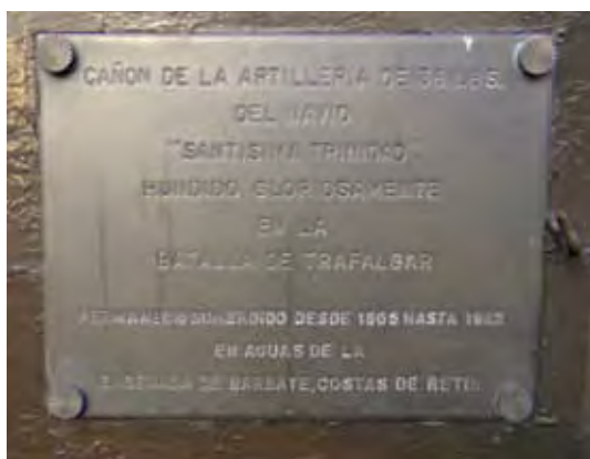
Placa identificativa de los cañones del Panteón.

Siempre que he tenido la ocasión de estar frente a esas reliquias del pasado me ha surgido la misma pregunta: ¿en qué se ha basado el autor de dicho texto para asegurar que esas piezas pertenecieron a tan insigne buque cuando todavía no se tiene constancia de que el pecio del Santísima Trinidad haya sido localizado?