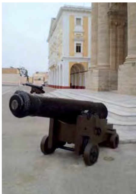
Cañones frente al Panteón de Marinos Ilustres de San Fernando.