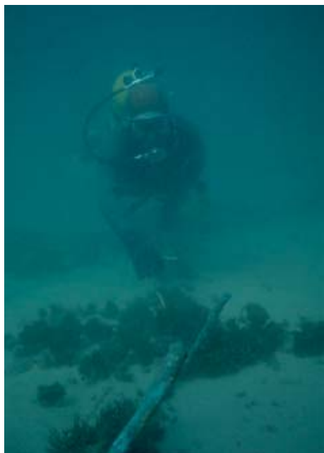
«Del lecho marino sobresalían alineados varios pernos de cobre...».