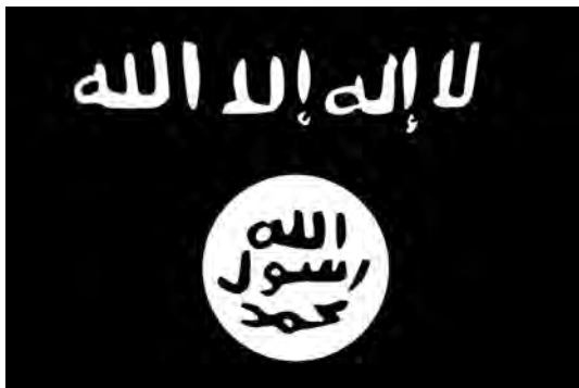
Bandera de Al Shabab. (Fuente: Internet).

una alternativa efectiva frente al desgobierno y la falta de legislación del país.