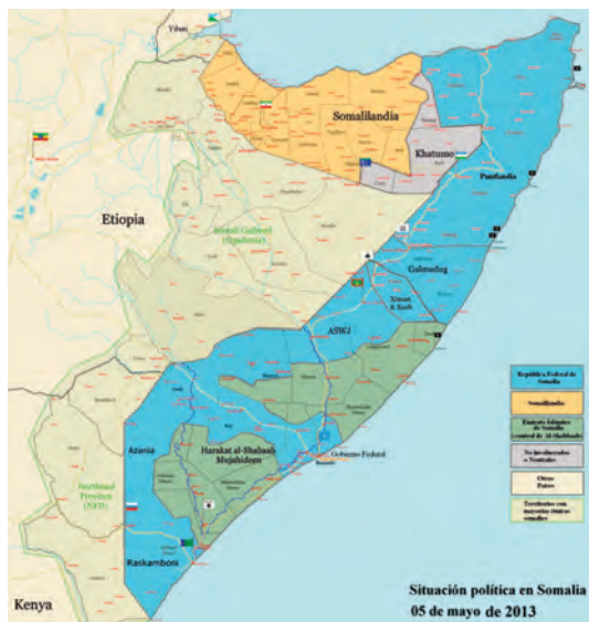
Situación política de Somalia a fecha 5 de mayo de 2013.

siones, aplicación extrema de la sharia , asesinatos indiscriminados, prohibición de reparto de la ayuda humanitaria, etcétera.