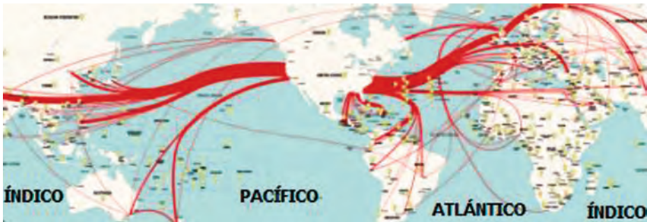
Global traffic map 2010.

Los países occidentales demandan que las empresas se expandan más allá del mundo desarrollado hacia áreas que conllevan riesgos mucho mayores que aquellos a los que están acostumbrados. Así, una de las zonas de mayor potencial de desarrollo es la gran creciente , que incluye Oriente Medio, Asia Central, India y el Sudeste Asiático, pero en ellas hay que afrontar mayores