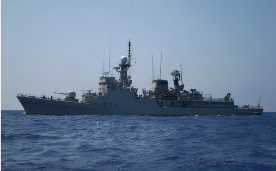
Corbeta Infanta Elena (actualmente patrullero de altura) de la clase Descubierta . (Foto: www.armada.mde.es ).

buques multipropósito recibieron un gran impulso, y las enseñanzas obtenidas perfeccionaron los procedimientos y la supervivencia en el combate en escenarios de alta intensidad.