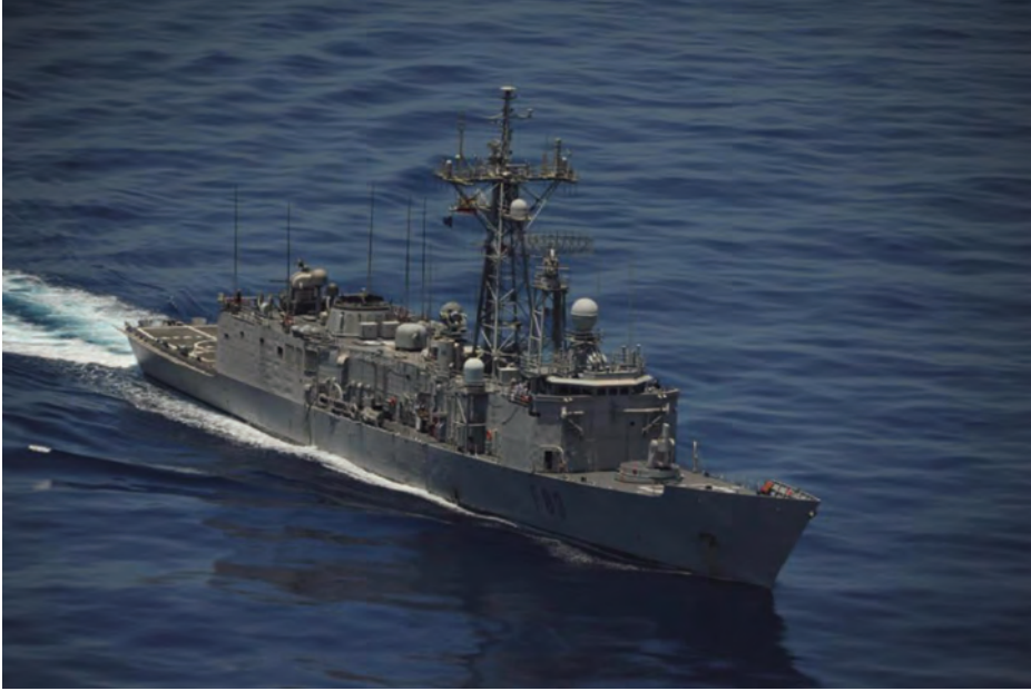
Fragata Numancia clase Santa María .