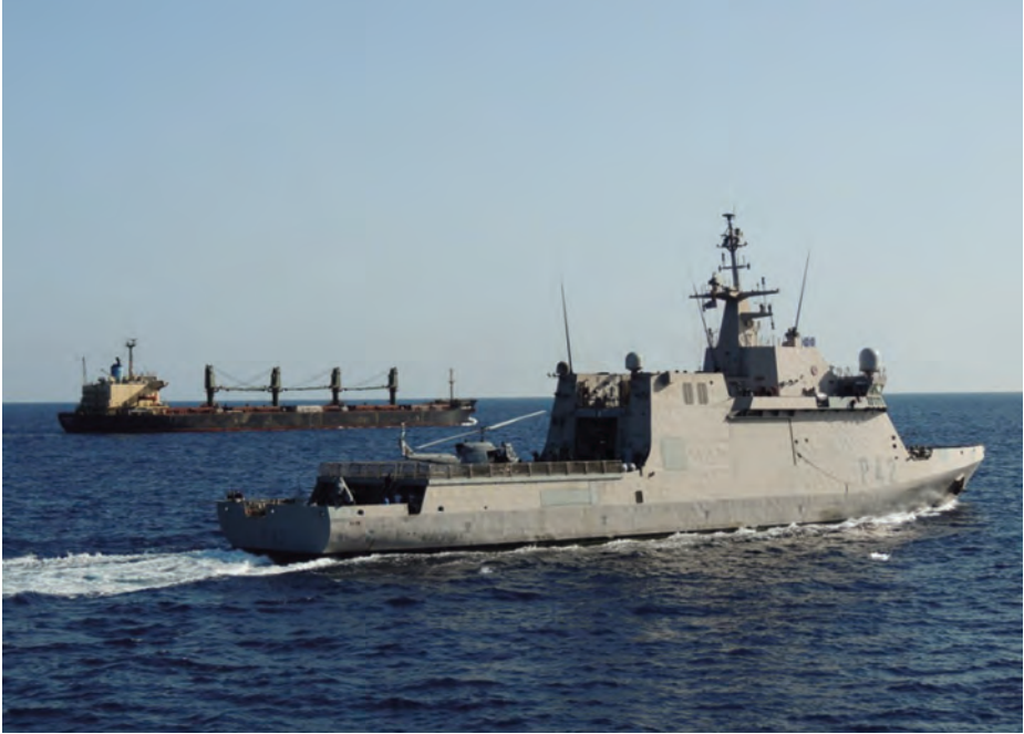
El BAM Rayo realizando una escolta al buque mercante Canarsie Princess en aguas del Índico.

mos, como las zonas económicas exclusivas, lejanos caladeros o extensas líneas de tráfico marítimo, han cobrado una gran importancia. Algunas marinas han preferido reducir los recursos dedicados a la capacidad de protección, ya suficientemente cubierta con el desarrollo de estas potentes fragatas y destructores, e ir sustituyendo sus escoltas costeros, principalmente corbetas, por patrulleros de altura ( Off-Shore Patrol Vessel ) que no necesitan de tan costosos sistemas de armas y llevan aparejada una importante reducción de sus dotaciones.