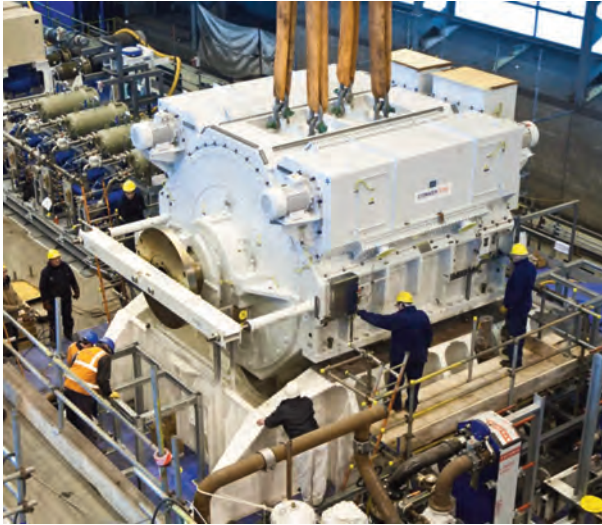
Motor eléctrico del Queen Elizabeth .

de gas exactamente iguales a las anteriores y cuatro diésel generadores Wartsila (dos de 9 MW y dos de 11 MW). Las turbinas podrán colocarse en las islas del buque, eliminando así los voluminosos conductos de aspiración y exhaustación, un cambio que sin duda traerá de cabeza a los diseñadores, pero que permitirá aprovechar el espacio al máximo. De la propulsión se encargarán dos motores eléctricos de inducción permanente (ver foto-