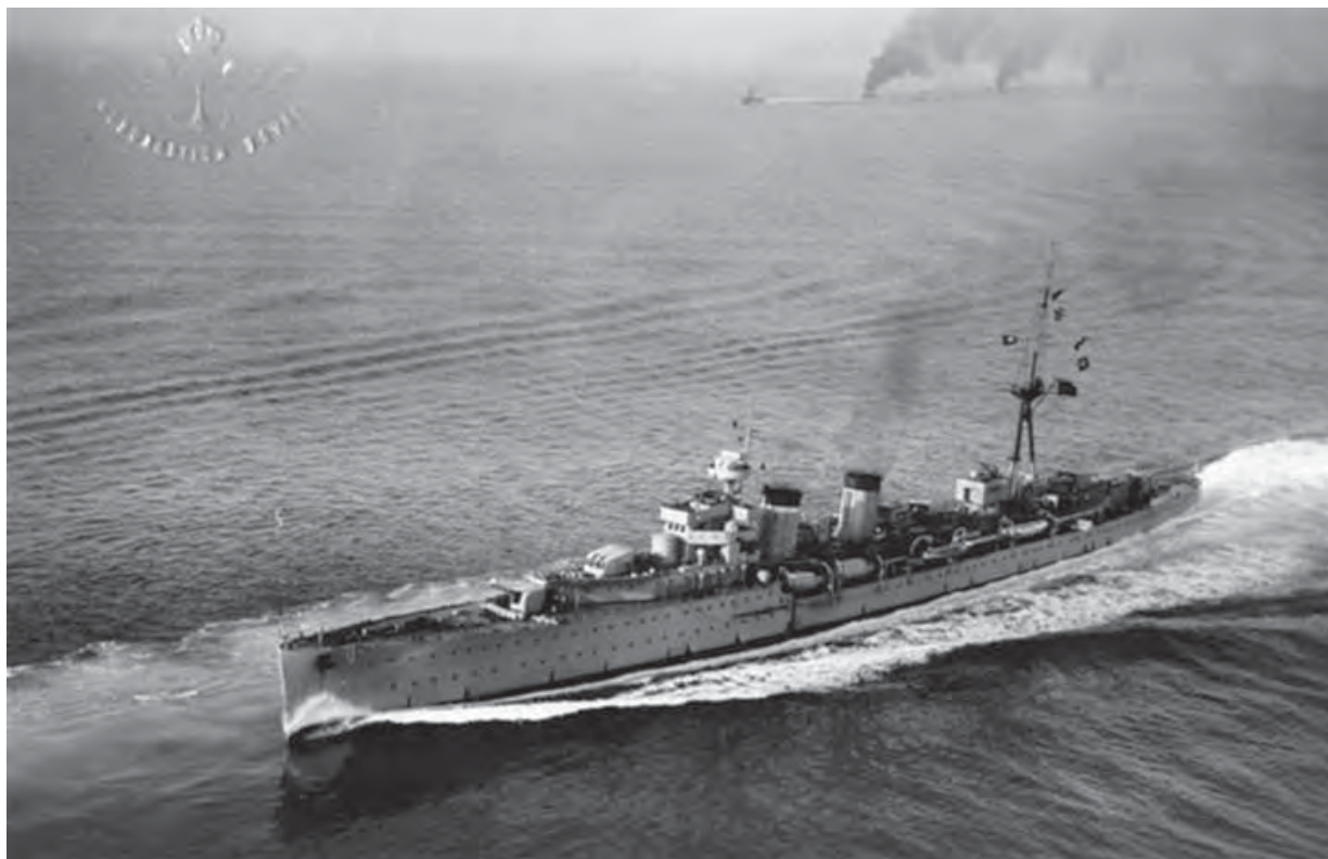
Crucero Almirante Cervera . (Foto: Aeronáutica Naval, año 1929).

Miranda y Maristany, por la comisión para llevar a cabo la valoración de todas las aportaciones que han hecho al Consorcio Nacional Almadrabetario, los concesionarios de Almadrabas».