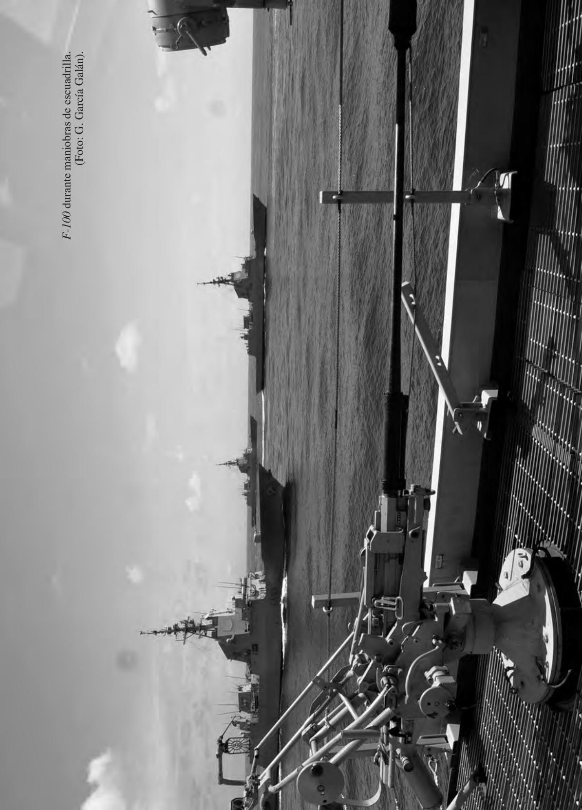
F-100 durante maniobras de escuadrilla.