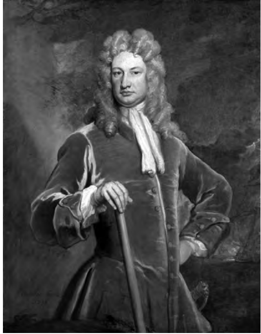
Sir Charles Wager (1666-1743).

Y en la hoja número 18, que abarca las proximidades de Cartagena de Indias, aparece un dibujo del enfrentamiento de la flota inglesa, al mando de Sir Charles Wager,