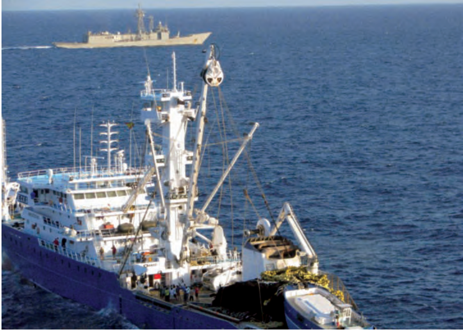
Pesquero español Alakrana . (Foto: https://www.vistaalmar.es/ ).

días regresaron a sus camarotes, de los que apenas eran autorizados a salir para ir al baño y a las comidas. Los piratas no les daban ningún tipo de descanso y continuamente les abrían sus puertas y paseaban delante de ellas por los pasillos, llegando incluso a efectuar disparos y recargar sus armas. Algunos días después del inicio del secuestro tuvieron conocimiento de que la Armada española había capturado a dos piratas que habían salido del Alakrana , lo que motivó que la situación fuese muy crítica para la tripulación. Los secuestrados fueron llamados a comparecer en el puente; se les ordenó tenderse boca abajo, amontonándose los últimos en llegar sobre los primeros. A continuación fueron disparadas varias ráfagas sobre sus cabezas, lo que causó el pánico entre los secuestrados. Y estos son apenas algunos de los episodios por los que tuvieron que pasar los marinos del pesquero.