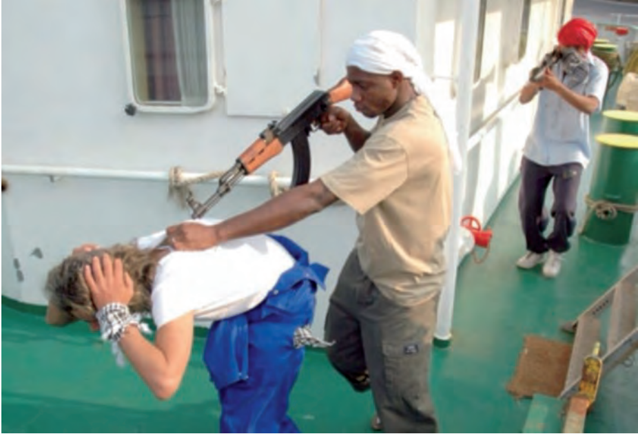
Tripulante siendo amenazado..

estos marinos se deben encontrar, teniendo en consideración los malos tratos y la miserable alimentación a los que habrán sido sometidos. Los que aún se encuentren en cautiverio tienen un futuro incierto, dependiendo su suerte de algún familiar o asociación que consiga reunir el dinero suficiente para su rescate, ya que sus empleadores hace tiempo que deben de haberlos olvidado.